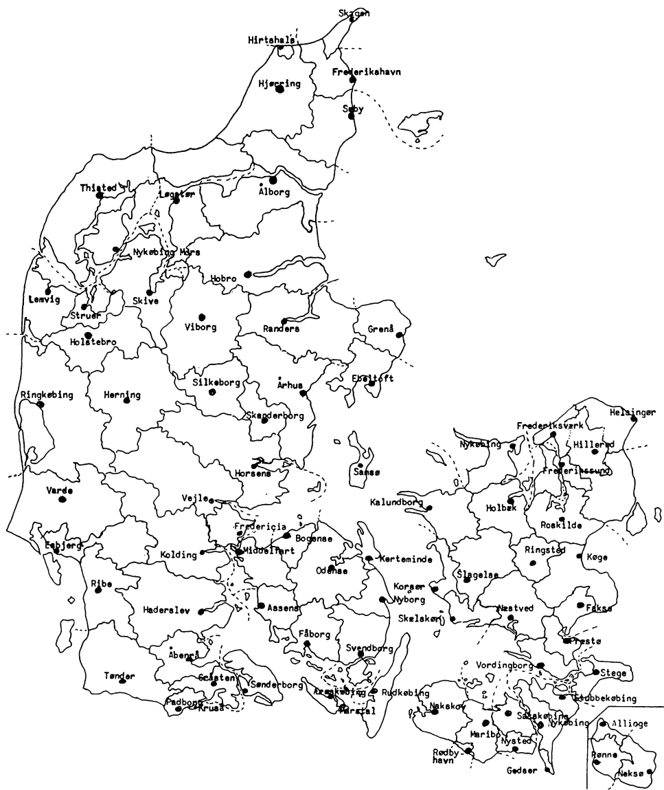
Tolldistrikternes grænser ca. 1967. Kort i Betænkning om toldvæsenets struktur, 1967, s. 46.