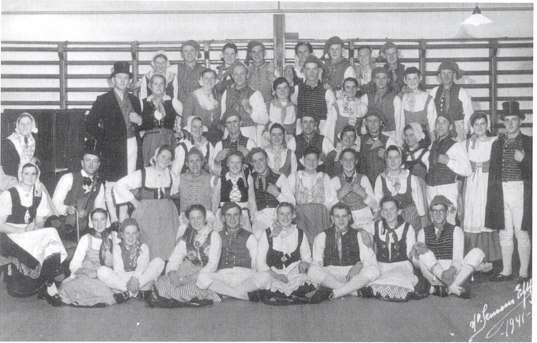
Folkedans var også en del af aktiviteterne i mange idrætsforeninger, om end der i mellemkrigsårene også helst skulle stå mere moderne dans på programmet, i alt fald ved festerne. Her er det folkedansere fra Trelde Idrætsforening, der i 1941 er stillet op til fotografering.

nerne på elementer fra bykulturen. I protokollen fra Gårslev Idrætsforening mellem Fredericia og Vejle kan man i 1948 læse følgende klare tegn på udhuling af bondekulturen: