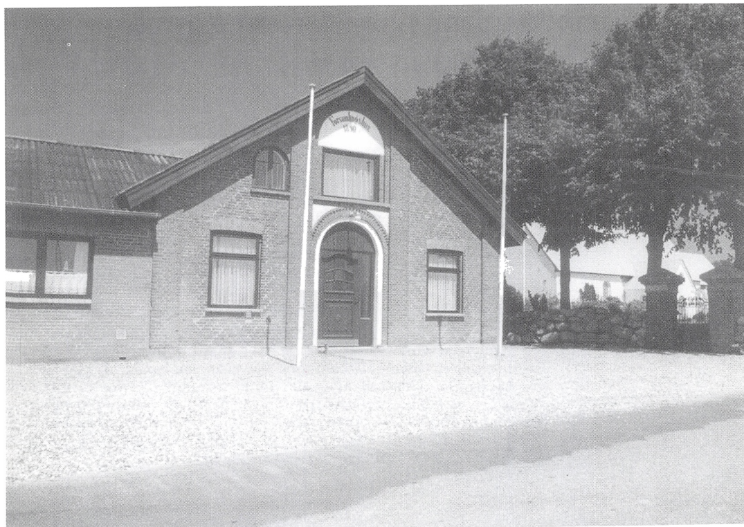
I den grundtvigske selvforståelse hørte aktiviteterne i forsamlingshuset og forkyndelsen i kirken nøje sammen. I Herslev opførte man da også i 1890 forsamlingshuset i umiddelbar nærhed af kirken. Forsamlingshuset i Herslev har gennem generationer været rammen om en væsentlig del af sognets sociale og kulturelle liv. Foto: Troels Kayser Nielsen 1994.

dansk mobiliseringsproces i 1800-tallet. Modsat Sverige, som indarbejdede »folkrörelserna« evolutionært i embedsmandsstaten, modsat Finland, hvor moderniseringen skete fra oven og blev et statsanliggende, og modsat Norge, hvor den alternative modernisering erobrede staten nedefra, opstod der i Danmark et parløb: ved siden af den sfære, som blev administreret af statslige embedsmænd, opstod der først i 1800-tallet en alternativ sfære, der organiserede et nyt samfund i form af først religiøse bevægelser, senere andels- og højskolebevægelse. 4 Om nogen organisk sammenhængende fællesdansk kultur var der således ikke tale. Snarere holdt de to fløje hinanden i skak.