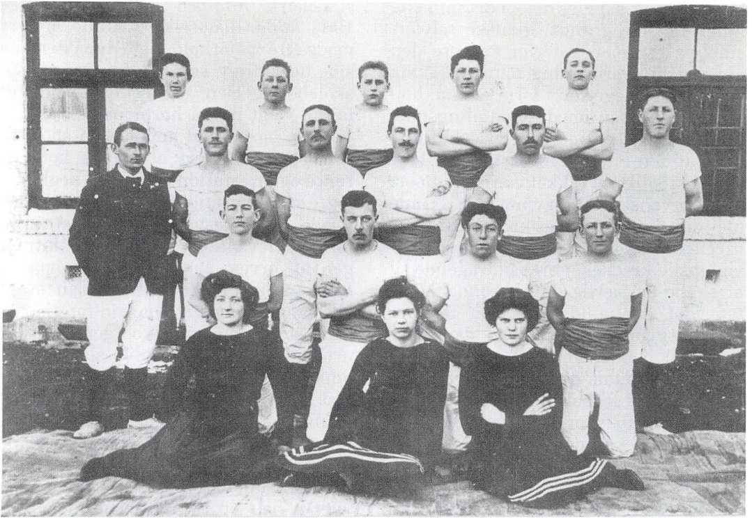
At den svenske gymnastik var en måde at udtrykke sin identitet og selvforståelse på, lyser ud af dette billede af et gymnastikhold fra Svysten omkring 1911. Både påklædning, opstilling og mimik signalerer her et hold selvbevidste gymnaster fotograferet i forbindelse med en gymnastikopvisning.

danske bondekultur. Dette er ikke et ganske uproblematisk forehavende. Det er således vigtigt at holde sig for øje, om man her primært tænker på produktionsmåden eller på de kulturelle selvforståelser, der knytter sig hertil.