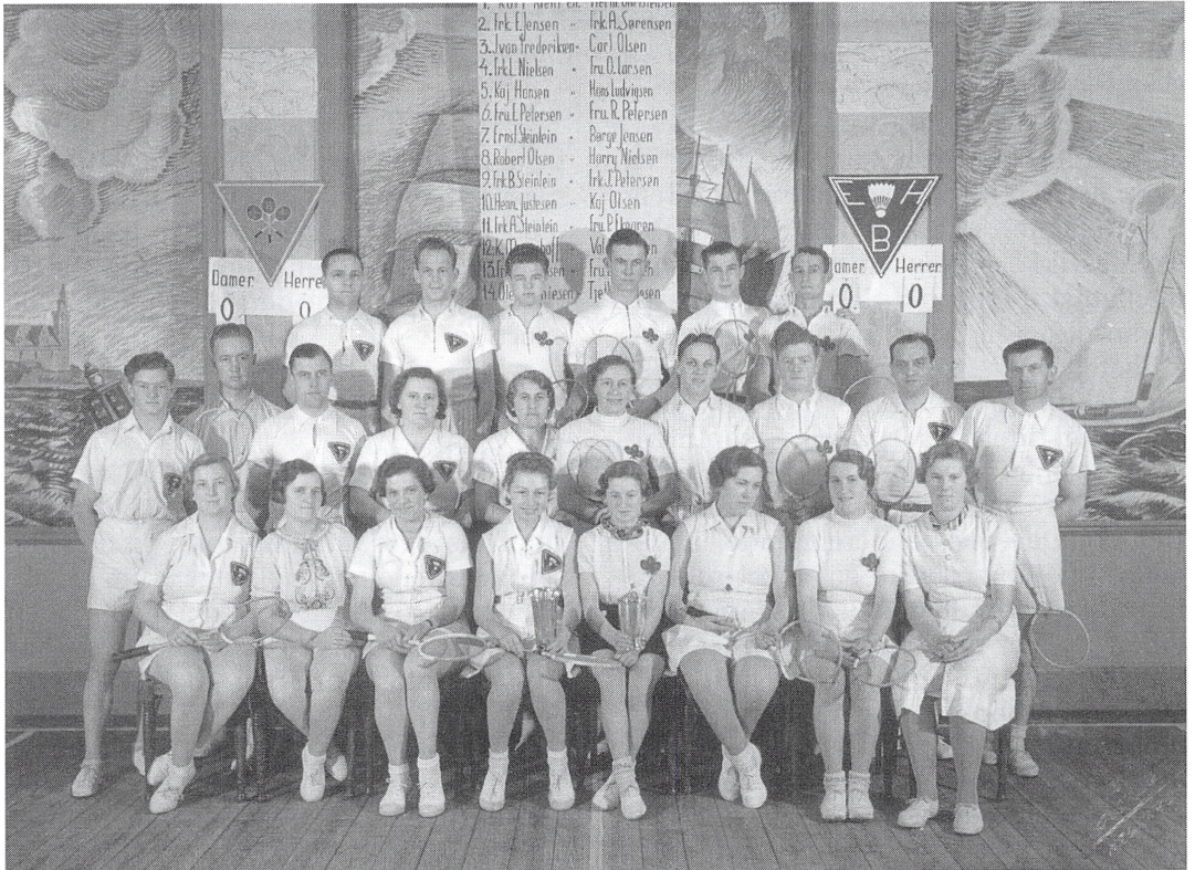
En sportsgren, der blev taget op i mange idrætsforeninger i mellemkrigsårene, var badminton. Her er Espergærde Idrætsforenings badmintonspillere fotograferet i salen på Hotel Gefion.

Til trods for at Gudbjerg er beliggende midt i det traditionelt set »vakte« sydfynske område og på trods af forbindelser til højskoleverdenen, har dette – som i Vejen hvor Askov Højskole og Sportsforeningen fra starten arbejdede tæt sammen 33 – aldrig forhindret, at den sportslige side af idrætten har været højt prioriteret siden introduktionen af sport i 1930'erne, samtidig med