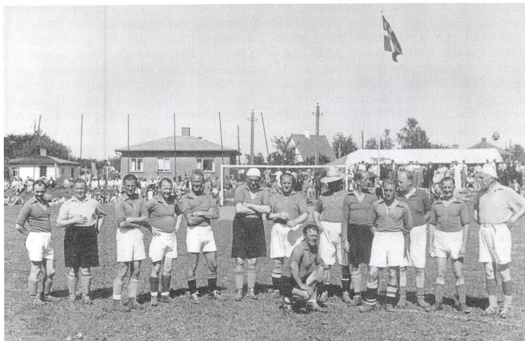
Sammenholdet under krigen smittede også af på idrætsforeningerne. I Espergærde sluttede byens borgere og landliggerne således op omkring Espergærde Idrætsforenings arbejde. Et udslag heraf blev »landliggerkampene«. Ved den første landliggerkamp udfordrede idrætsforeningen de gamle landligger-oldboys til kamp om 11 gode cigarer – en sjælden vare på det tidspunkt. Arrangementet blev en stor succes med 1.500 tilskuere. Denne kamp fulgtes af flere lignende dystre, som alle blev sommerens store festforestilling.

foreningen, men til gengæld blev Espergærde Badmintonklub oprettet, ligesom Idrætsforeningen under 2. verdenskrig også lavede en badmintonafdeling; de blev i 1945 blev sluttet sammen som en selvstændig badmintonafdeling inden for EIF. 39