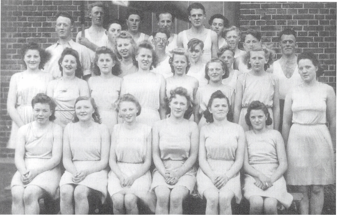
Fra 1936 tog man i Trelde Gymnastik- og Idrætsforening også håndbold på programmet, og det satte nyt liv i foreningen og gav øget tilslutning også til gymnastikken, som det fremgår af dette billede fra gymnastikopvisning i Trelde forsamlingshus i 1943.

hele taget med de øvrige landsbyer på egnen. Håndbolden var et nyt frist pust, der bidrog til at bringe Trelde ud af sin tornerosesøvn. Sportsfesterne rundt omkring på egnen sommeren igennem markerede en helt ny situation i forhold til den traditionelle lokale gymnastikopvisning i forsamlingshuset sidst på vinteren. Om det så er hygiejnen i forbindelse med idrætten, synes den at have haft gavn af håndbolden: Efter træning, som i starten foregår ved Strandgården, kunne man bade i fjorden.