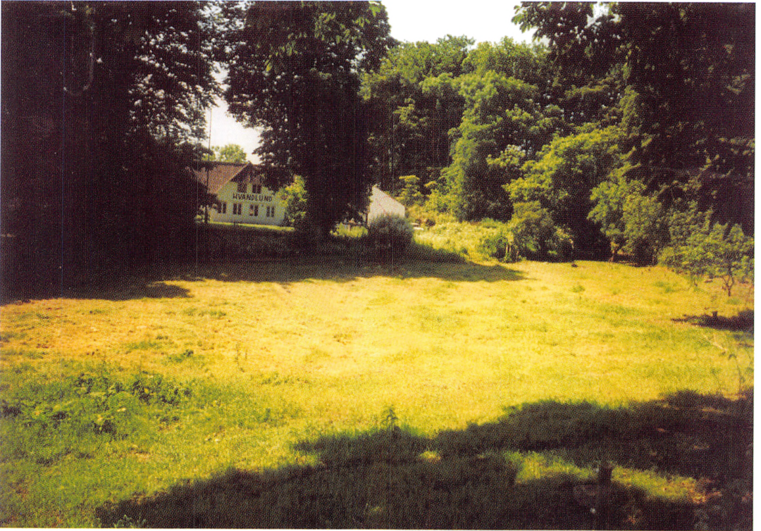
Pavillonen Hvandlund, smukt beliggende i Elbodalen vest for Fredericia, var i en periode fra midt i 1930'erne til først i 1950'erne en hård konkurrent til Herslev Forsamlingshus, når idrætsforeningen skulle finde et sted at afholde bal. Den blev også stedet for en økonomisk øretæve, som nær havde sat foreningen ud af spillet.

trerer man sig herefter ligeligt om håndbold og gymnastik, medens man i Herslev og Syvsten kort ind i 1940'erne synes at være blevet mest ambitiøs på fodboldspillets vegne, som til gengæld ikke spiller nogen rolle i Gudbjerg. Det afgørende er imidlertid, at der i alle tilfælde satses på mere end gymnastik alene, nemlig både gymnastik og boldspil, dvs. sport. Om noget modsætningsforhold mellem disse to idrætsformer kan man ikke tale. Snarere supplerer de hinanden. Til gengæld er det ganske tydeligt, at det er takket være boldspillet, in casu: håndbold og fodbold, at der kommer liv i idrætten i 1930'erne. Det er med andre ord sporten, som sætter fart i idrætten, medens gymnastikken alene ikke er i stand hertil. Til gengæld