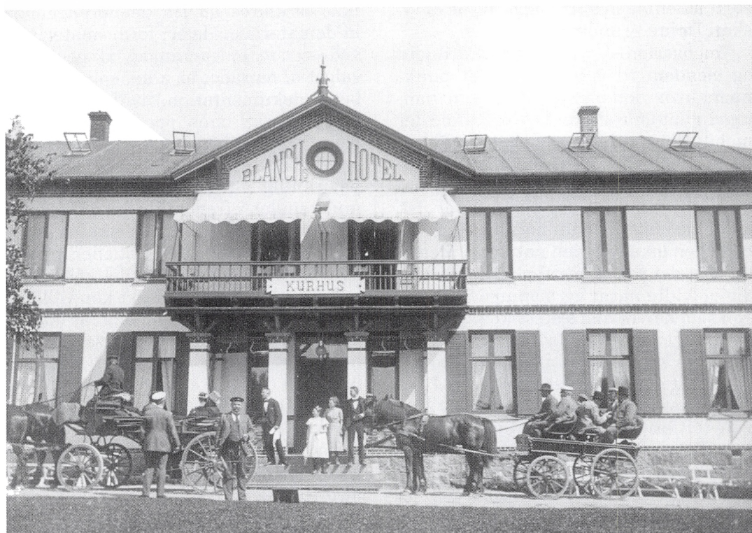
Blanchs Hotel i begyndelsen af århundredet. Hotellet blev bygget i 1887 af J. Blanch på galgebakkerne ved Hammershus. Det var Bornholms første og mest fashionable badehotel, der til samtidens tilfredshed herefter kunne imødekomme turisternes krav til komfort og service. Skoven omkring hotellet blev omdannet til et – stormomsust – park- og haveanlæg med udsigtsteder, en statue af Christian IV og en pseudorunesten. Efter etableringen af Østersøbadet Bornholm (Ostseebad Bornholm) i Sandvig i 1894 blev Blanchs Hotel benævnt som kurhus for badet. Hotellet er i dag revet ned og har givet plads til en Dansk Folkeferie-by. Kun runestenen står tilbage som levn.

sekonsumentation af området og erhvervets kommercielle udnyttelse af det.