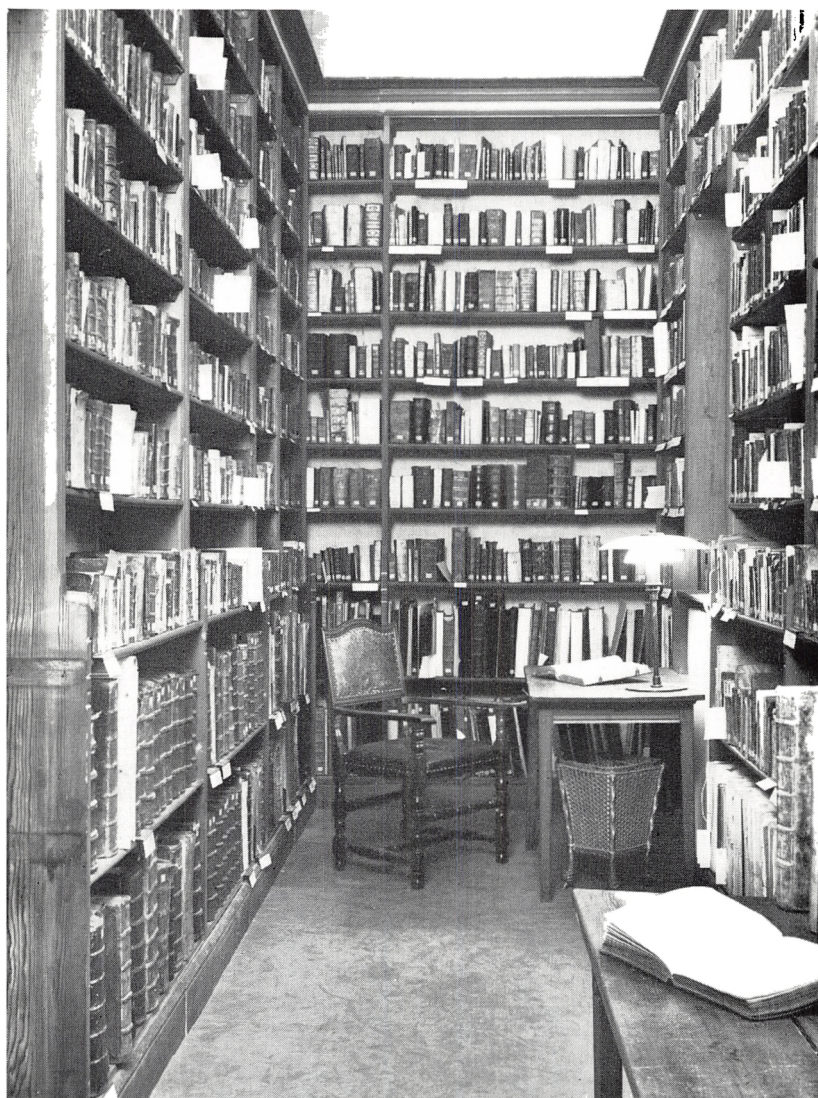
Karen Brahes Bibliothek.