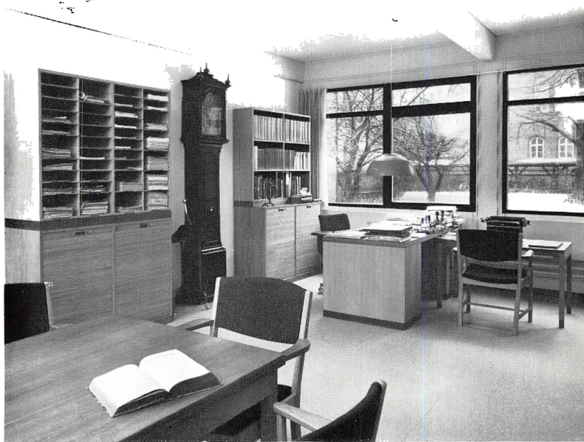
Landsarkivarens ny kontor. Tilbygget 1968–69.

Set fra forbindelsesgangen mellem kontorfløjen og den gamle bygning. Yderst til højre landsarkivarens kontor.