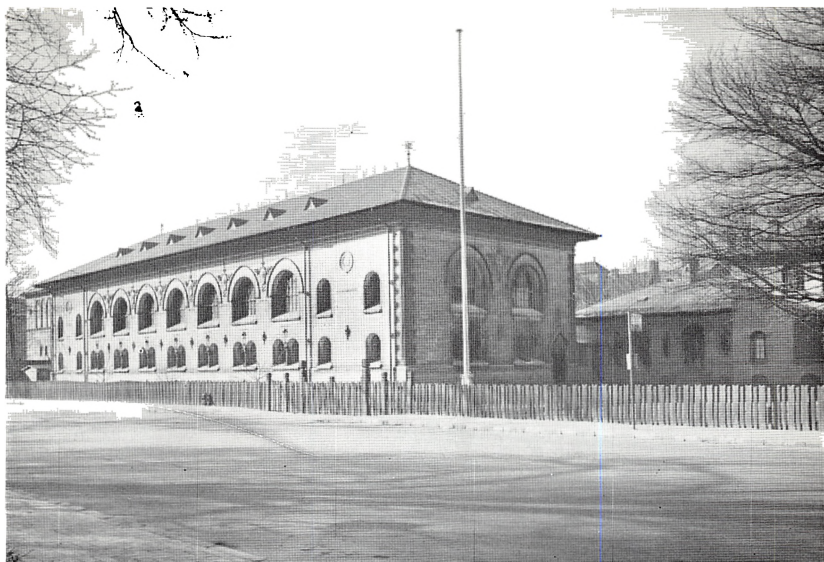
Landsarkivet for Fyn 1960.

Til venstre magasinbygningen i to etager. I baggrunden i midten læsesalen i én etage. Til højre en del af landsarkivarboligen i to etager.