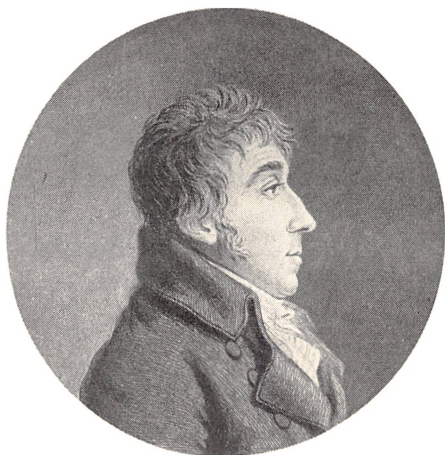
Portræt: og Landskabsmaler Søren Løvsøe Lange.