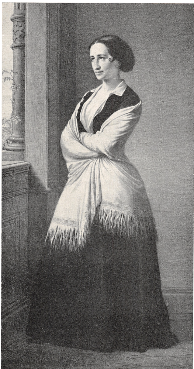
JOHANNE LUISE HEIBERG