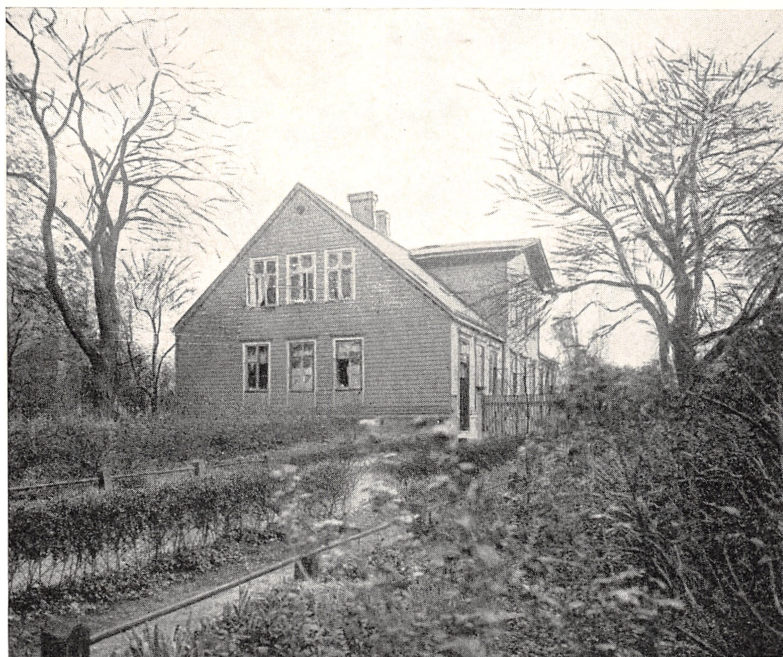
ØSTERBROGADE 7 C (STUEN) ANDRÆ'S HJEM 1859-93