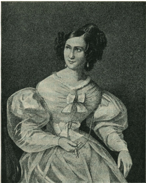
Johanne Luise Heiberg. Maleri av Aumont 1832—33.