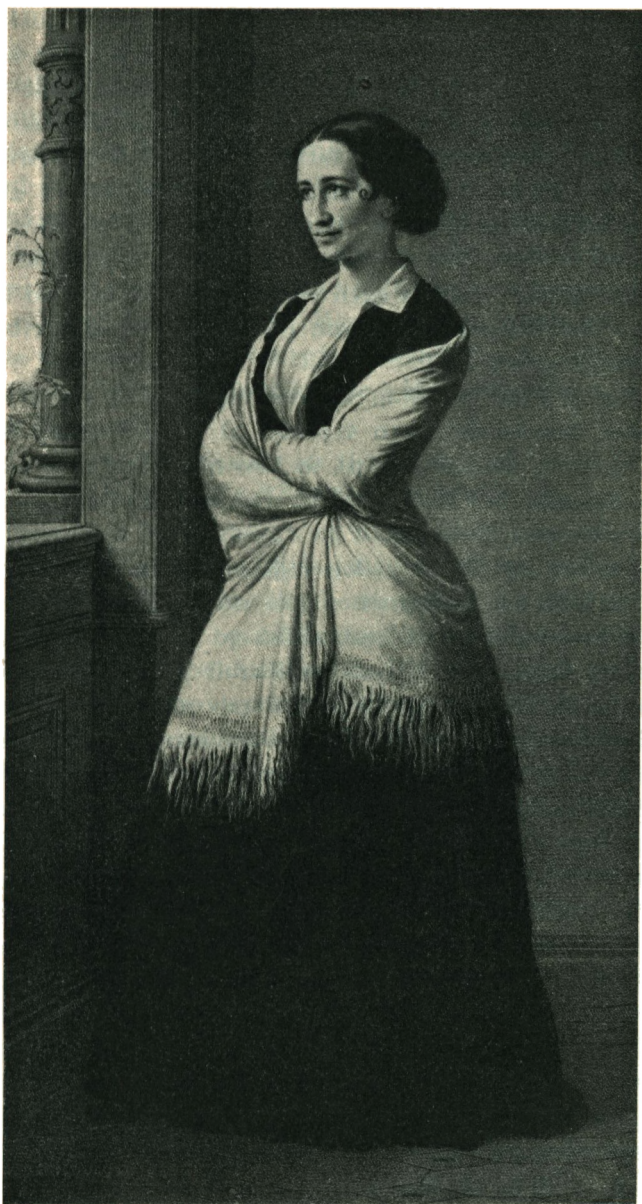
Johanne Luise Heiberg.

Maleri av Marstrand 1858—59 (Frederiksborg).