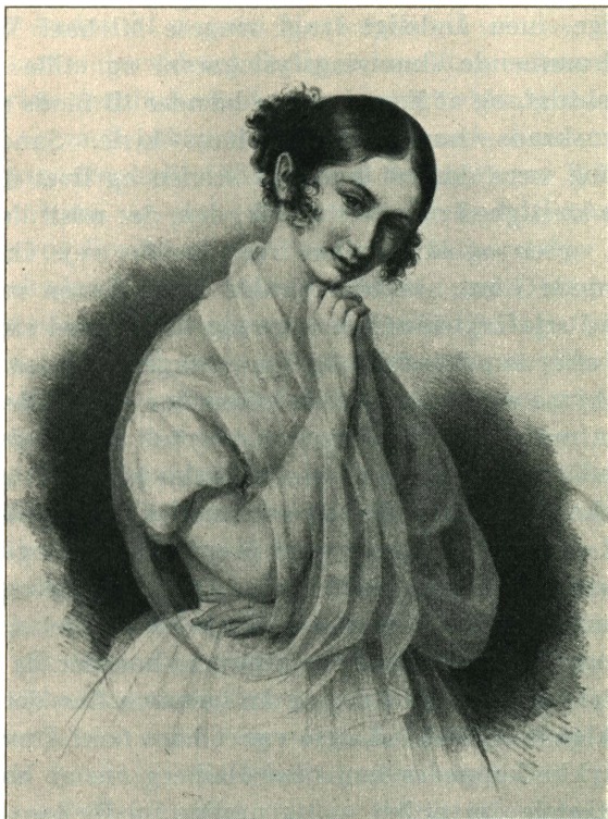
Johanne Luise Heiberg.