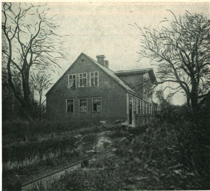
Østerbrogade 7 C (stuen) Andræ's hjem 1859—93.