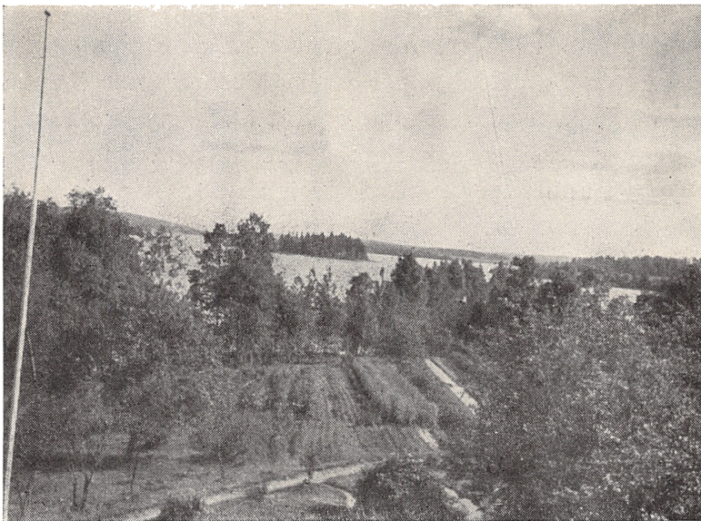
Udsigt fra Loftsaltanen paa »Saarela» mod Syd over Parken mod Varassaari og Aulanko Aas 1932.

Hans Forfædre kendes i Mandslinjen tilbage til 1500-Aarene i Finland.