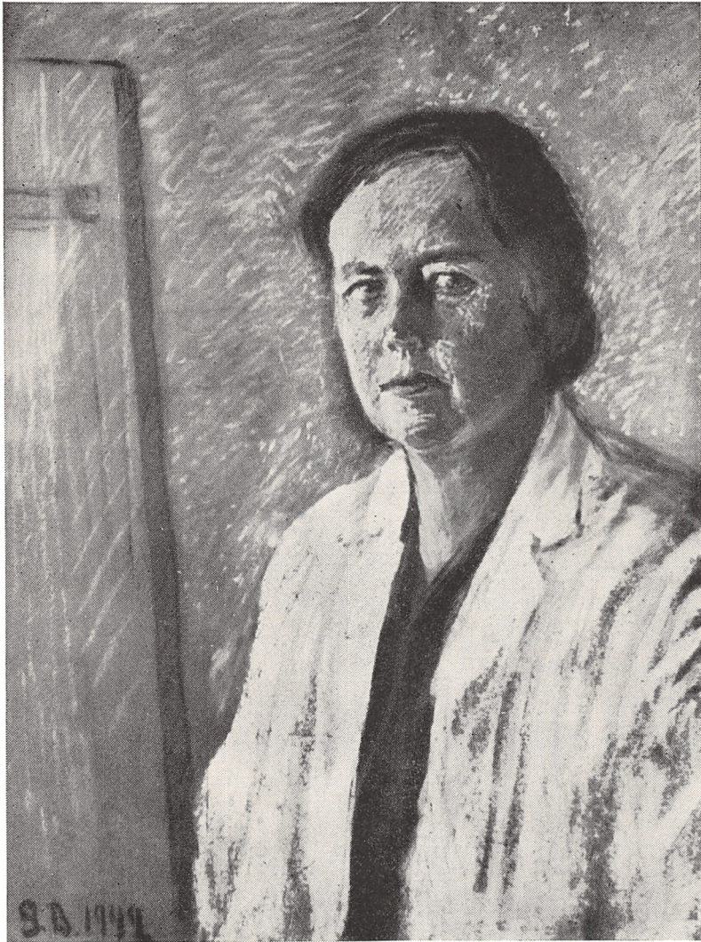
Gertrud. Selvportræt. Pastel. 1942.