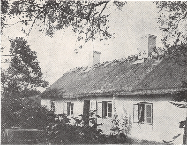
»Krogen» i Karlebo, set fra Haven. 1937.

Vi fortrød heller ikke Købet, da vi næste Foraar fik Huset ordentligt gjort i Stand og fjernet en Del af de 57 Ribsbuske i Haven, saa vi kunde rydde til en Græsplæne. I Havens Udkanter var der flere gamle Frugttræer og ved den østre Gavl et stort Æbletræ, i hvilket der mærkeligt nok voksede en lille Gran. Desværre forgik dette lille Træ sammen med en Del af de andre og Vedbenden, som dækkede hele Østgavlen, i de strenge Krigsvintre 1940—42.