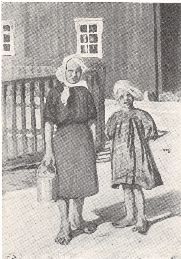
Smaapiger. Mäkelä, Tavastland. Maleri af Gertrud Solitander. Olie. c. 1910.

deles gode og viser, at hun beherskede Tegningen, der nu engang er det grundlæggende for at kunne male, tilfredsstillende. Ligeledes findes, foruden hendes færdige Malerier, en Mængde Skitser til Oliemalerier.