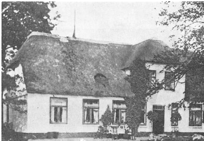
Hovedbygningen til herregården »Høgelund« 3 km øst for Læk. Fotografi fra o. 1930.