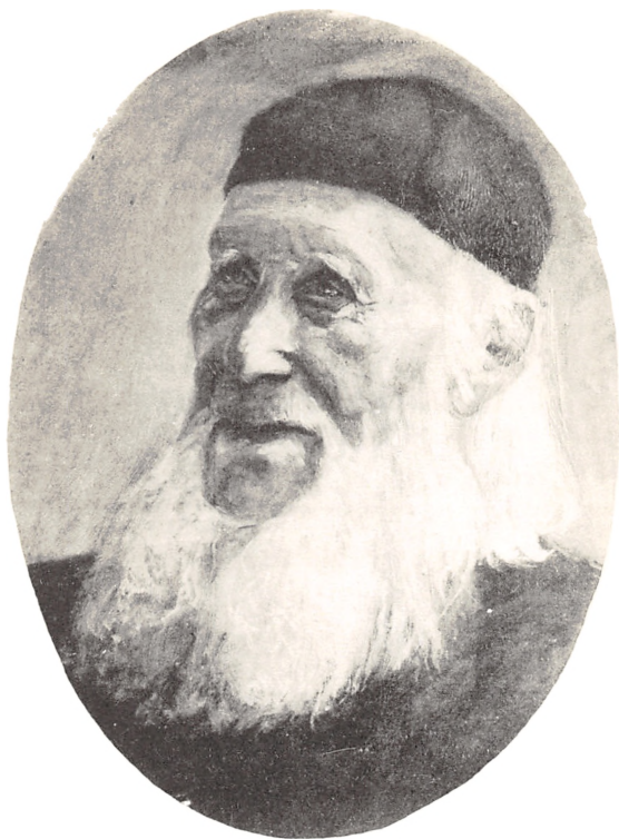
JUSTITSRAAD, AMTSFORVALTER FREDERIK CHRISTIAN KABELL . RIDDER AF DANNEBROG. 1808—1903 .