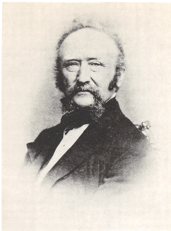
ETATSRaad CARL FREDERIK AUGUST LUNN TIL KNABSTRUP 1808—1886