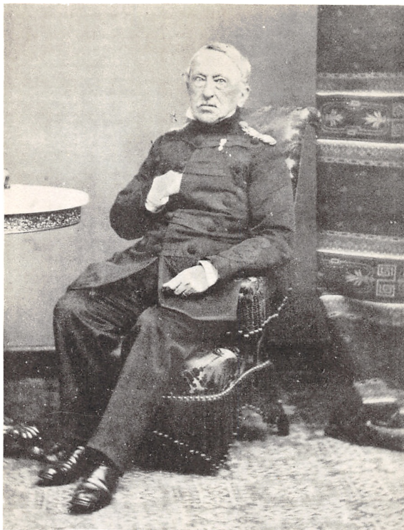
GENERALLØITNANT NIELS CHRISTIAN LUNDING STORKORS AF DANNEBROG OG DANNEBROGSMAND 1795—1871