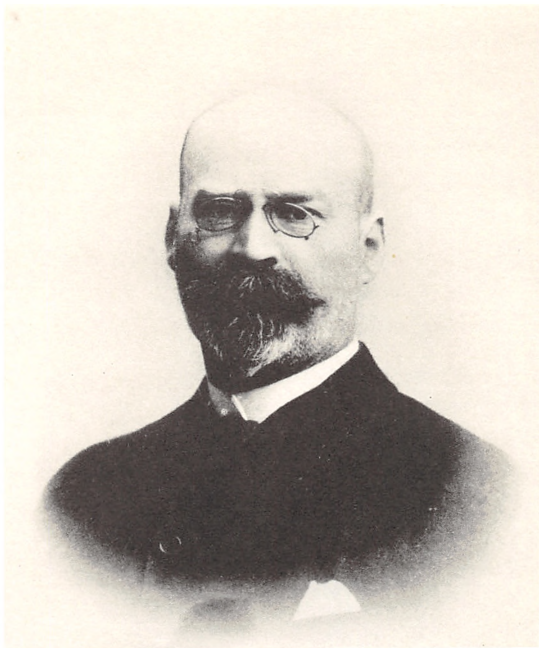
ARKITEKT HENRIK PHILIP SMIDTH 1855—1938