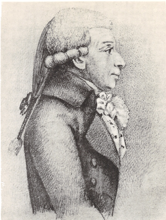
JUSTITSRÅD CHRISTIAN DITLEV LUNN TIL KNABSTRUP 1737—1814