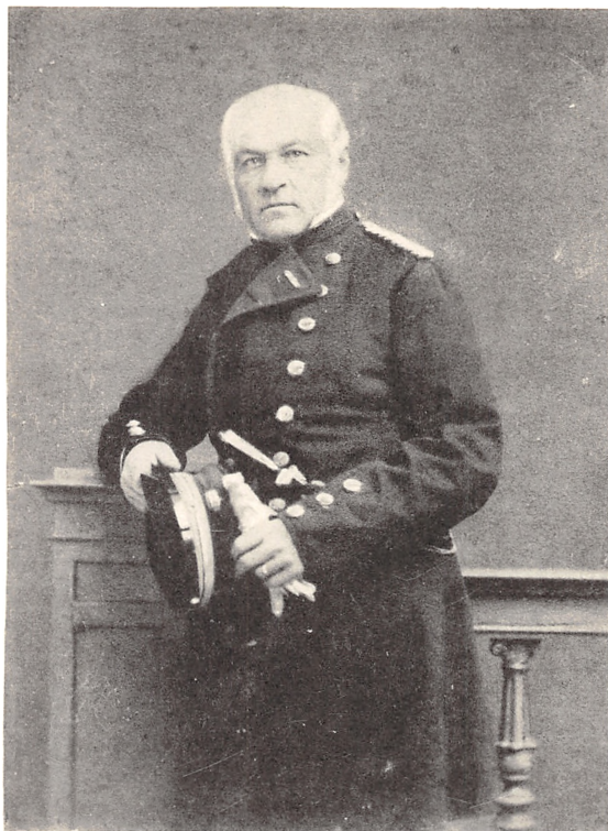
VICEADMIRAL EDOUARD SUENSON STORKORS AF DANNEBROG OG DANNEBROGSMAND 1805—1887