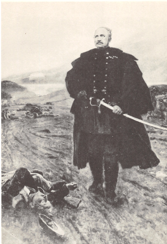
GENERALMAJOR OLAF RYE RIDDER AF DANNEBROG OG DANNEBROGSMAND 1791—1849