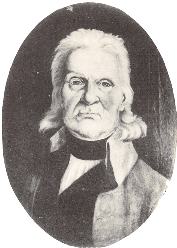
STADSTAMBOUR CHRISTOFFER SØRENSEN KABELL 1739—1822