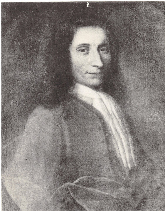
KOFFARDIKAPTAIN MATHIAS IBSEN LUNDING 1690—1728