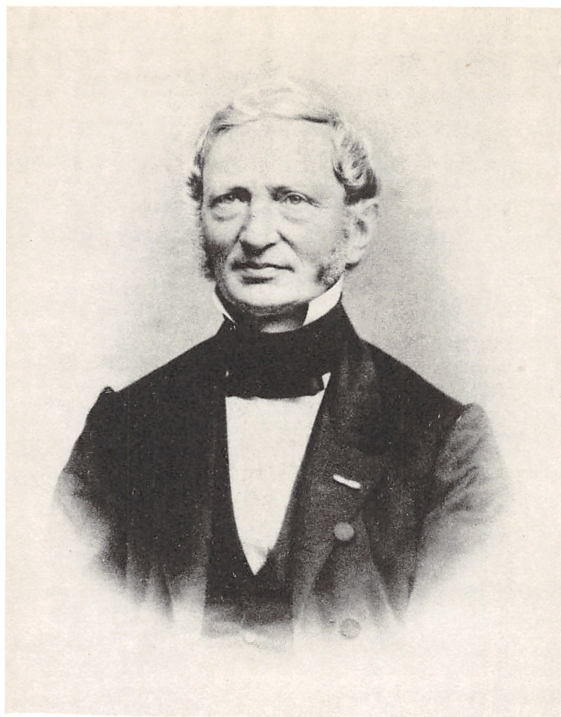
KONFERENSRAAD, OVERFORMYNDER CHRISTIAN DITLEV LUNN KOMMANDØR AF DANNEBROG OG DANNEBROGSMAND 1804—1890