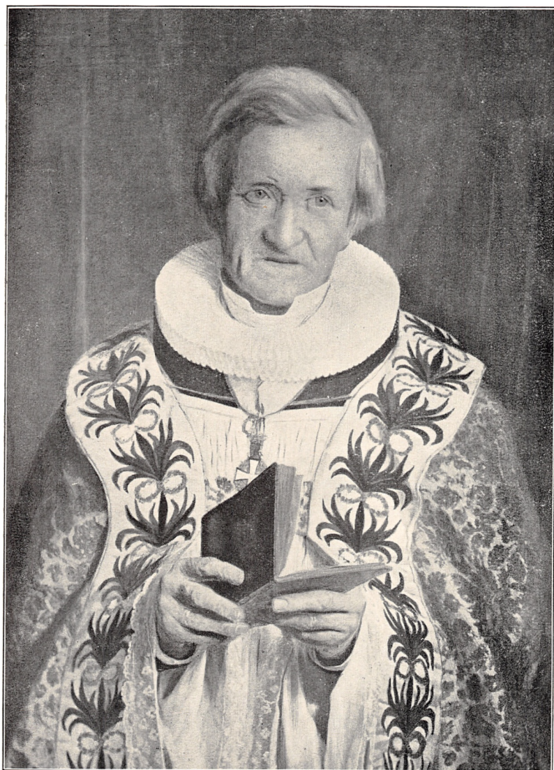
BISKOP OVER VIBORG STIFT HARDENACK OTTO CONRAD LAUB (1805—1882)