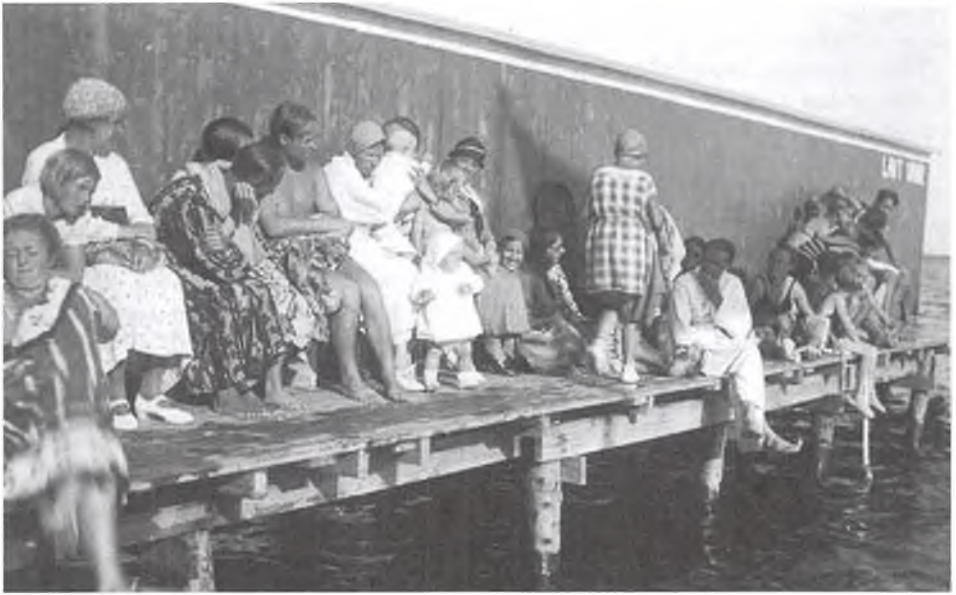
Badeanstalten Dragør 1933. Badenymer af enhver slags.