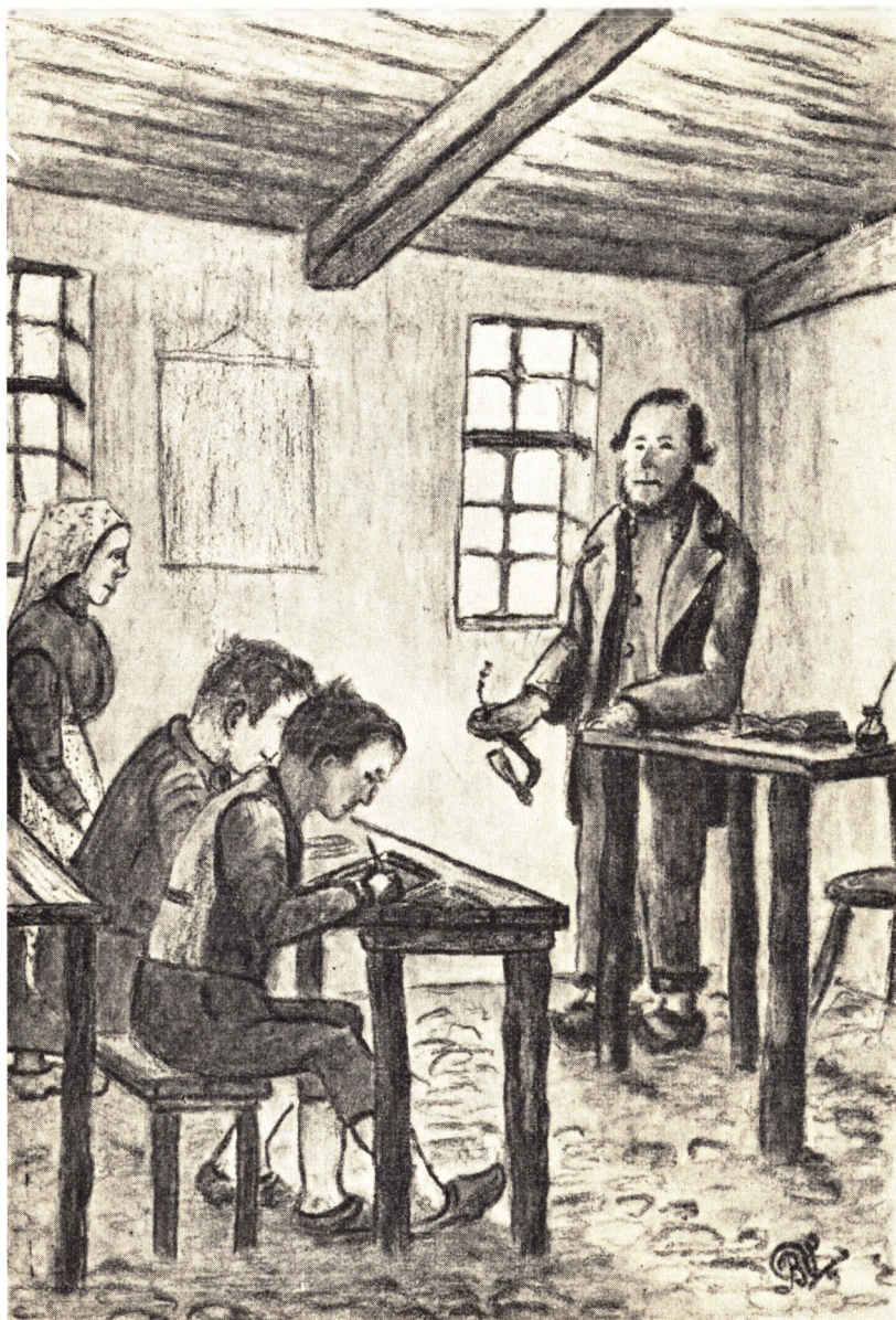
En landsbyskole 1814