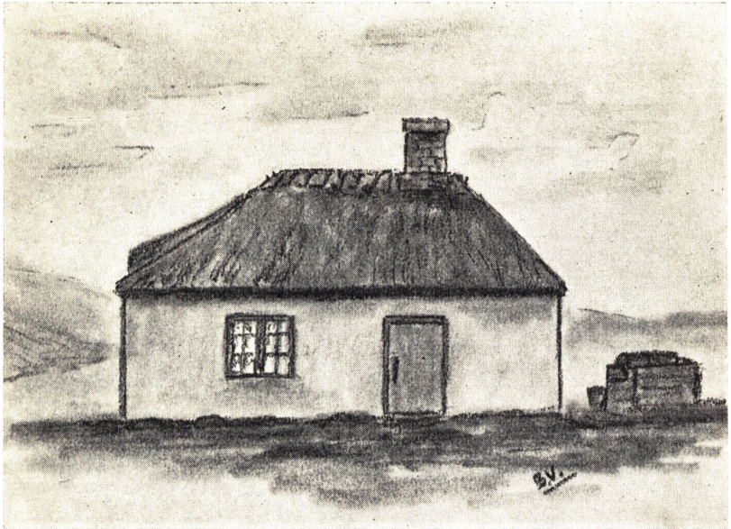
Vejby skole indtil 1872