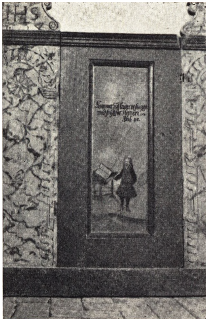
Degnestolen i Fjeldsø kirke 1634