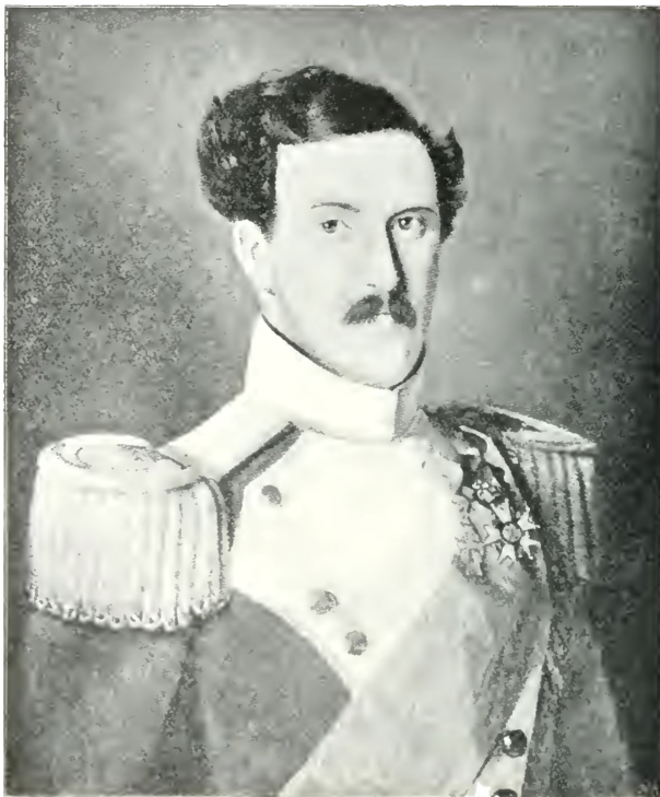
PRINS FREDERIK CARL CHRISTIAN FREDERIK VII.)