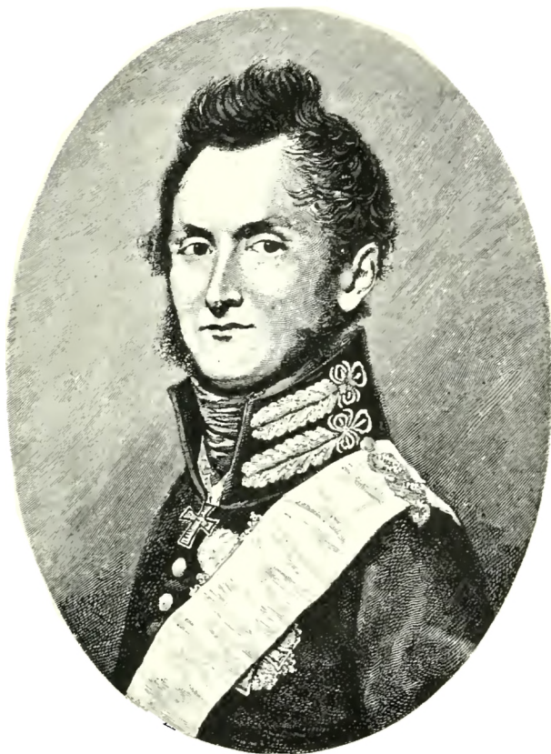
HERTUG WILHELM AF HOLSTEN-BECK-GLÜCKSBORG.