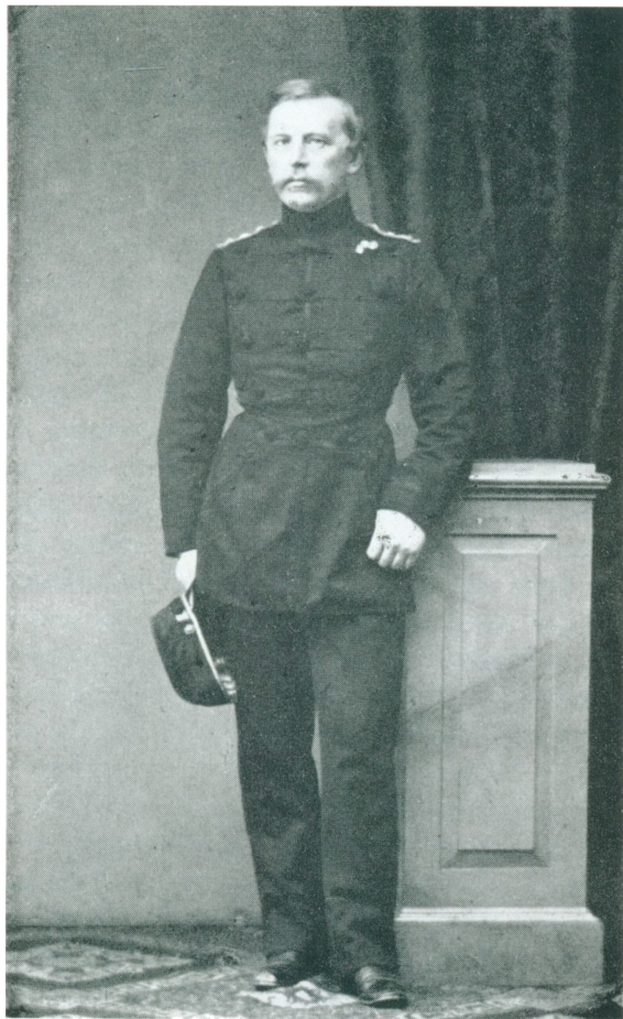
KAPTAIN von ROSEN Fotografi fra 1860