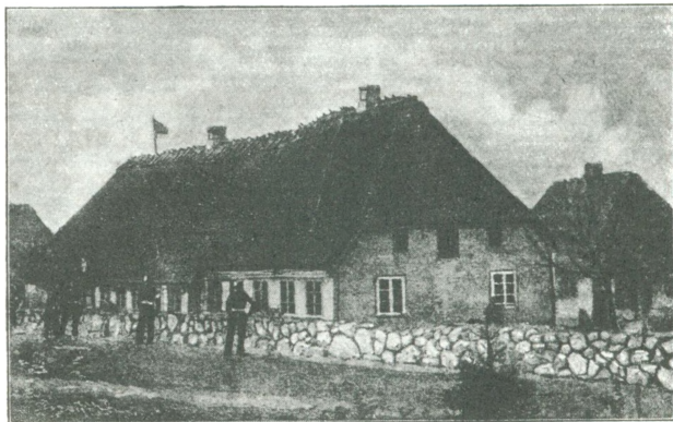
Nybøl Skole, under Krigen Lasaret.