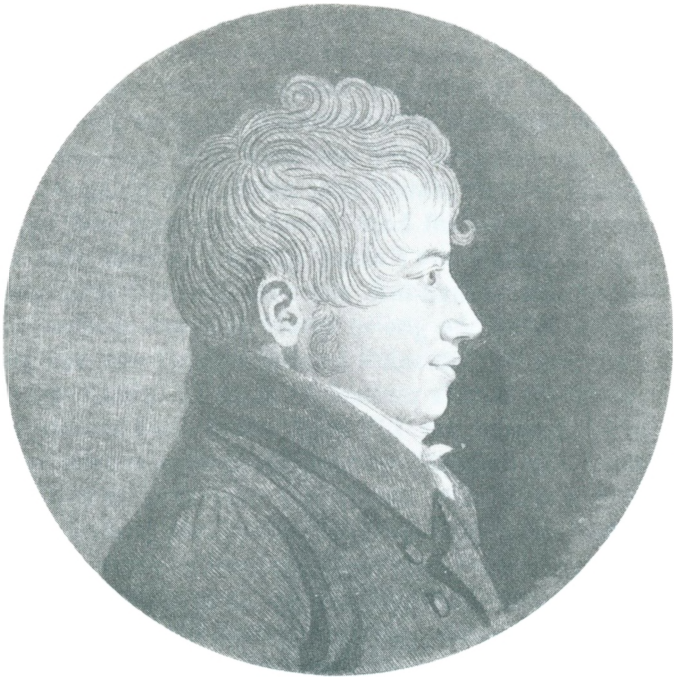
P. O. BRØNDSTED A. Flindt grav.