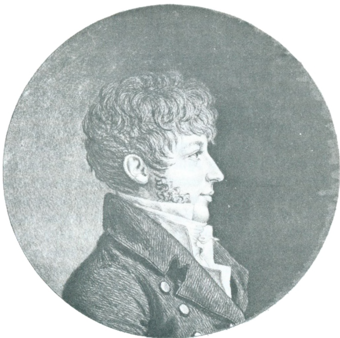
P. O. BRØNDSTED.