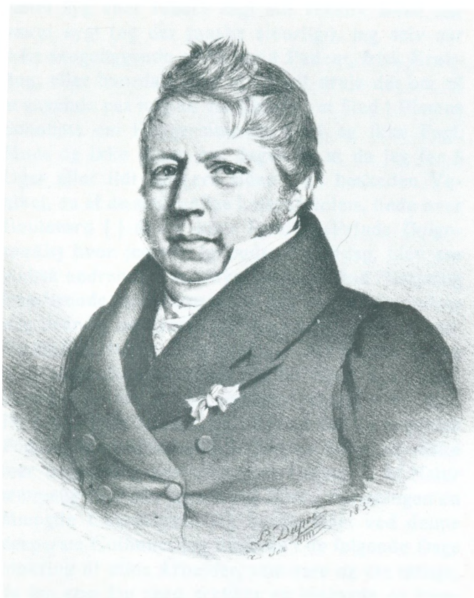
P. O. BRØNDSTED Maleri af La Dupré 1833