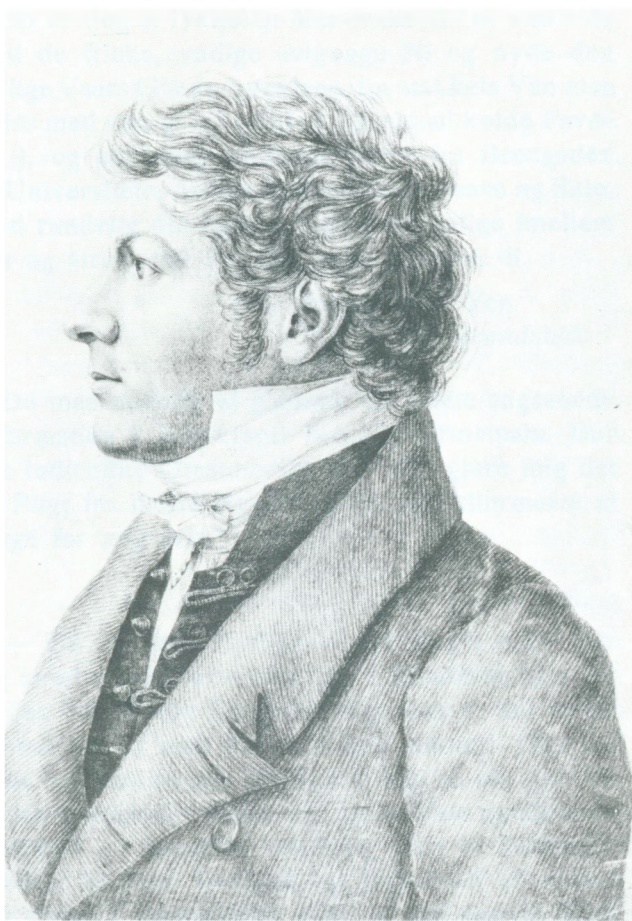
Ungdomsbillede af Brøndsted Sortkridtstegning af Ploetz