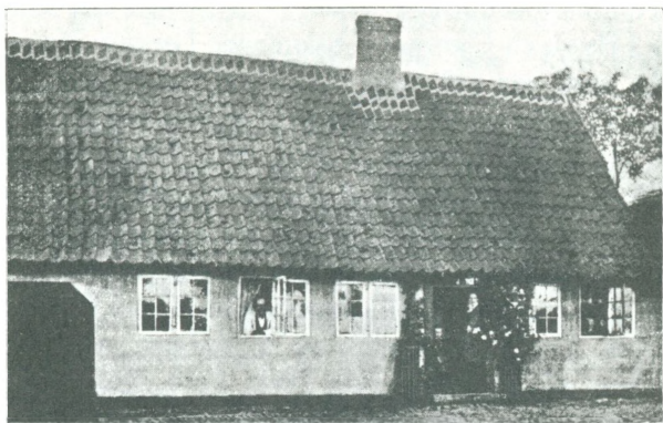
Forfatterens Fødested i Fredericia.