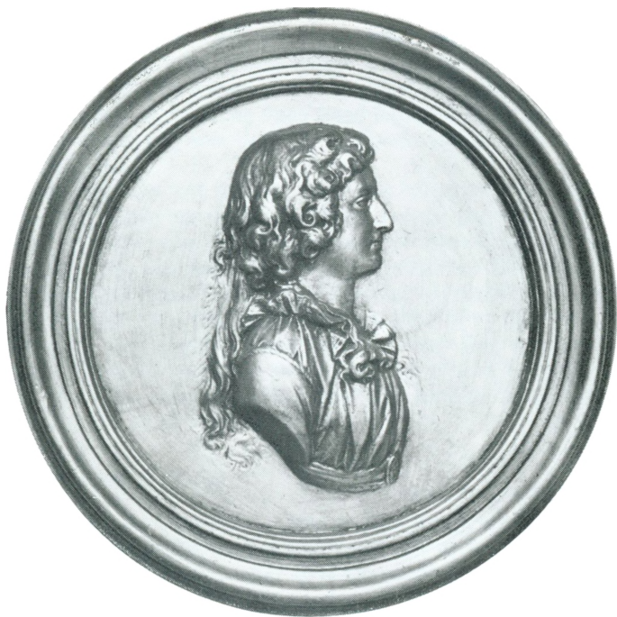
JOHANNE ROSING Medaillon af Thorvaldsen ca. 1790.