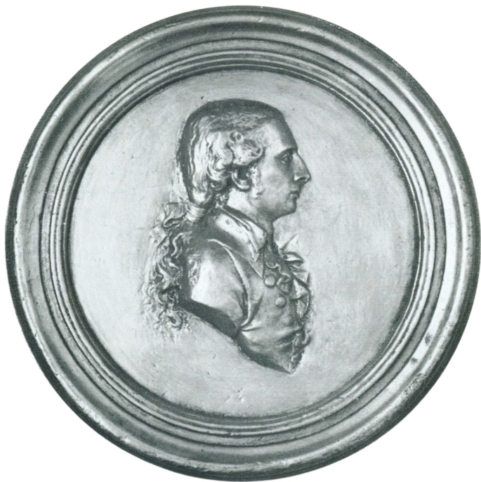
MICHAEL ROSING Medaillon af Thorvaldsen ca. 1790.