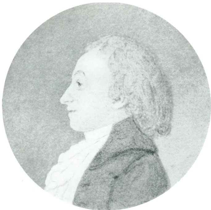
KNUD LYNE RAHBEK