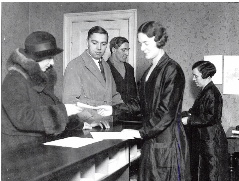
Århus Kommunes folkeregister november 1933. – Registret var en underafdeling af skattekontoret. På denne side ses ekspeditionsskranken, hvor folk kunne aflevere flyttemeddelelser, på modstående side ses ekspedition i hovedregistret og i navneregistret (små skuffer).