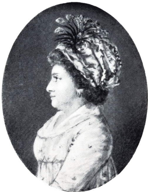
BIRTHE EMERENCE BECH f. RESTORFF Efter Maleri af Richter 1797.