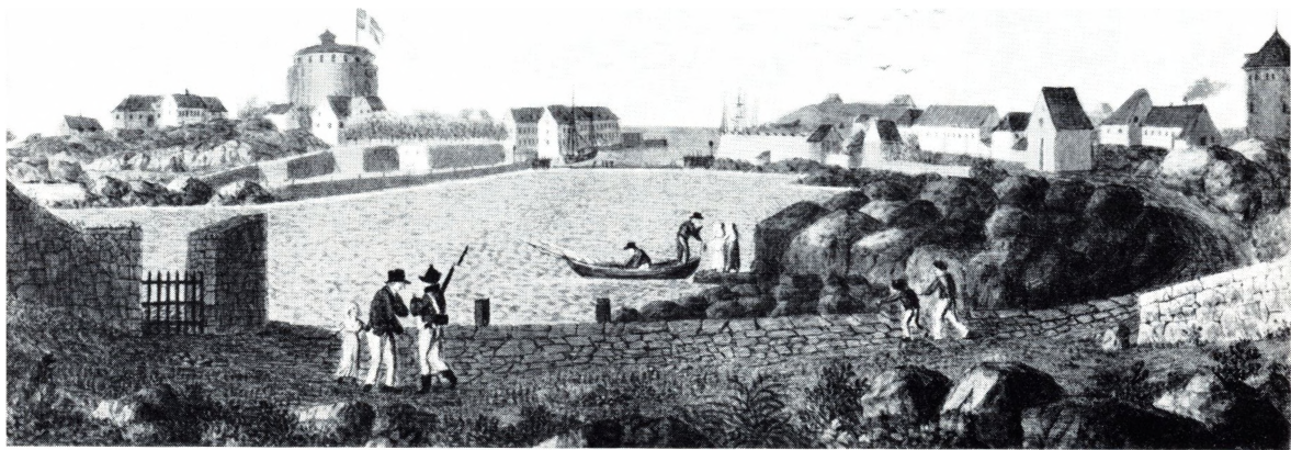
CHRISTIANSØ Nordre Havnen.