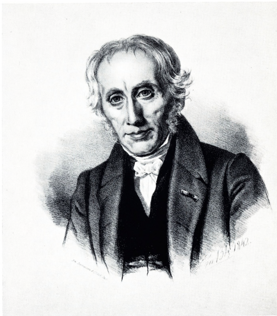
E. C. WERLAUFF Efter Lithografi af Bærentzen 1842