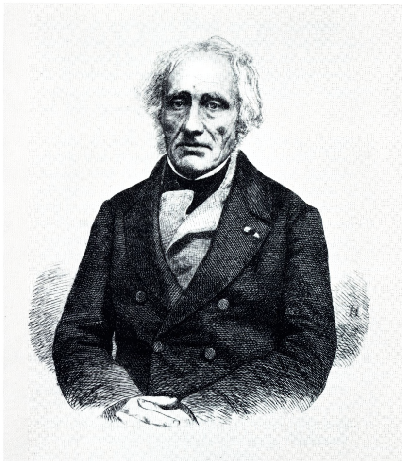
E. C. WERLAUFF Efter Træsnit af H. Olrik 1861