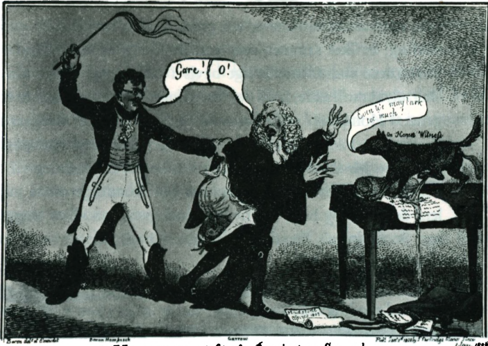
A HOME-PUSH or Witness Browbeating Council.

til fundne portræt af Hompesch. En tegning af Adam Buck , portræt af Hompesch, udstillet af The Royal Academy 1808, er ikke fundet.