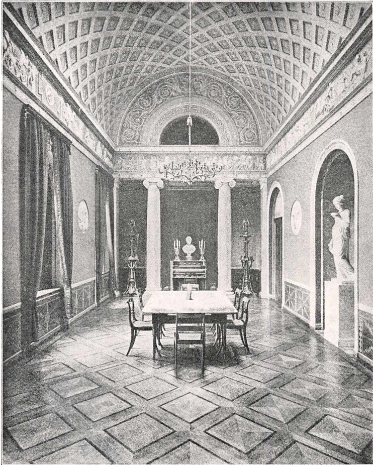
SPISESTUEN PAA CARLSBERG