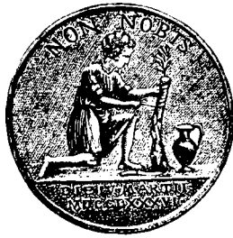
Bianco Lunos Bogtr. Kbhvn.