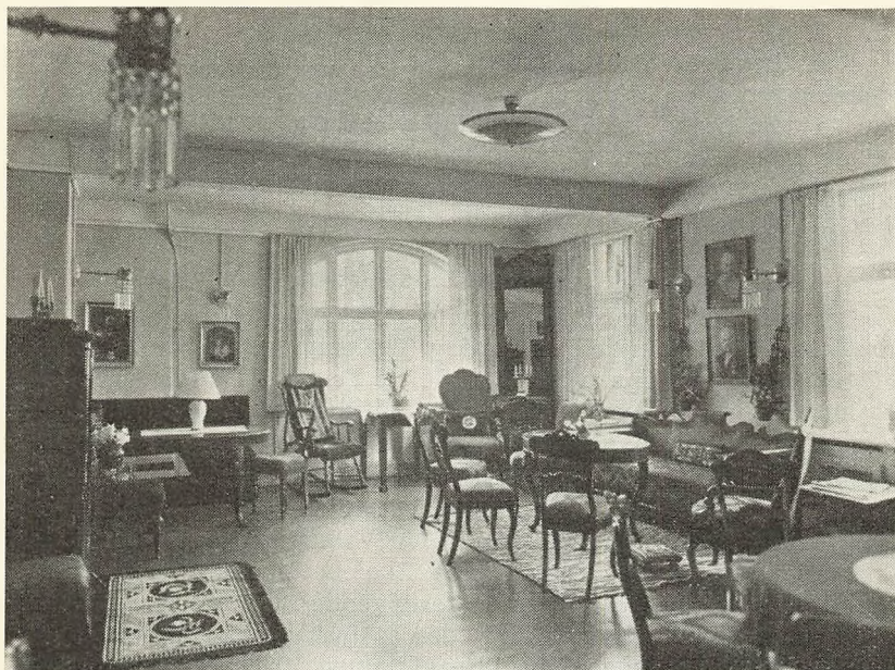
Dagligstue i Skolehjemmet for Piger