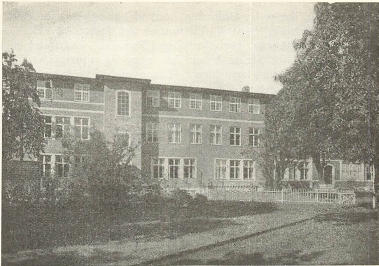
Den nye Bygning, set fra Haven