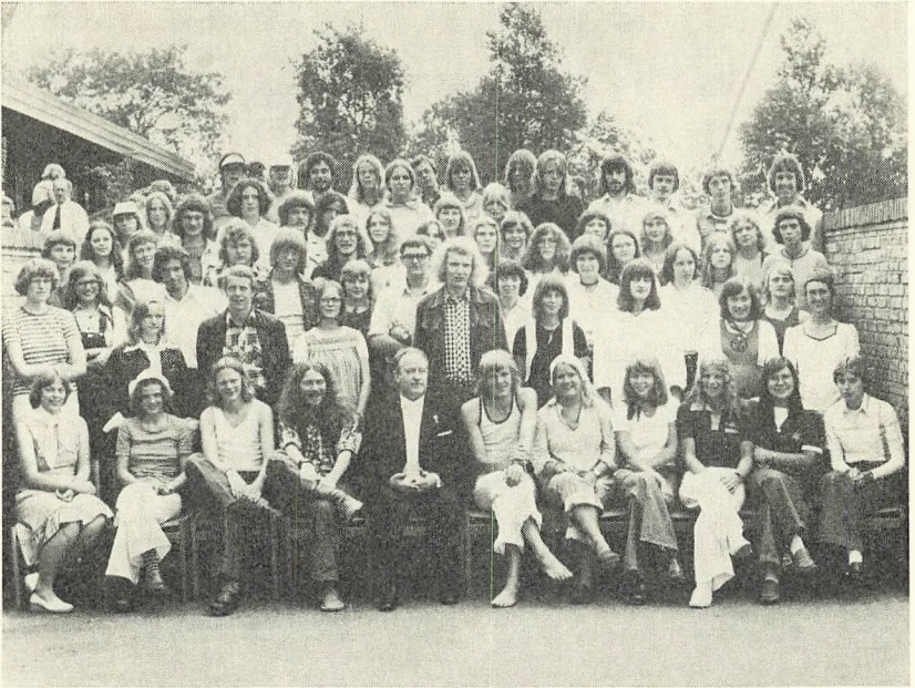
HF afgangsklasserne 1977

Den samfunds-matematiske gren har samme timetal i samfundsfag og geografi som den samfundssproglige. I matematik og fysik har den samme timetal som den naturfaglige, mens den i faget biologi følger den matematisk-fysiske linie. De samfundsfaglig/matematiske elever 2 timer færre i kemi i 2.g i forhold til de to andre matematiske grene.