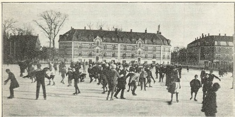
Det store frikvarter på skolens isbane.

For drengenes vedkommende har undervisningen og