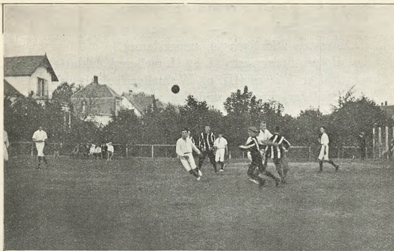
Fra skolens mindre idrætsplads (håndboldkamp med Helsingør h. almenskole.

nyttet til øvelser i det fri, lege og boldspil (langbold og kurvbold).