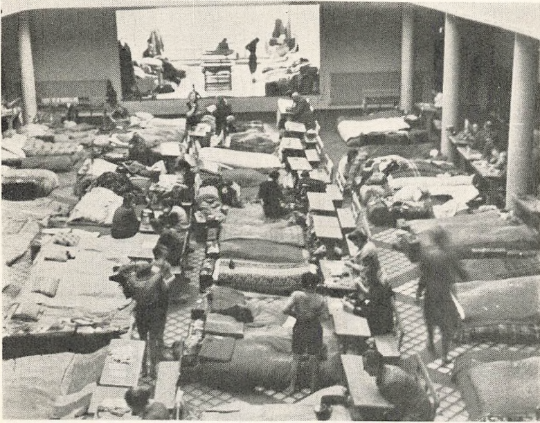
Tyske Flygtninge installeret i Sønderjyllandskolens Aula April 1945.