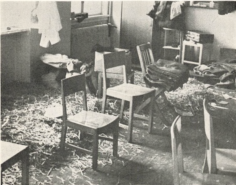
I Opbruddets Tegn. Klasserørelse paa Søndermarks skolen August 1945.