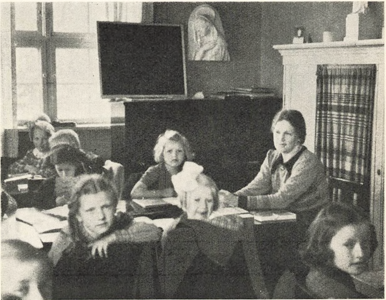
Undervisning i en Lærerindes Hjem.