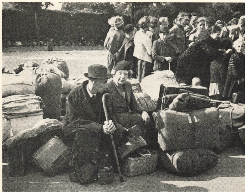
Tyske Flygtninge forlader Søndermarksskolen.