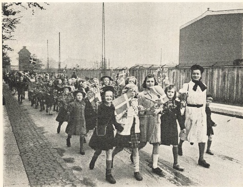
Vi vender hjem! Eleverne fra Skolen paa la Coursvej paa Vej til Skolen den 30. April 1946.