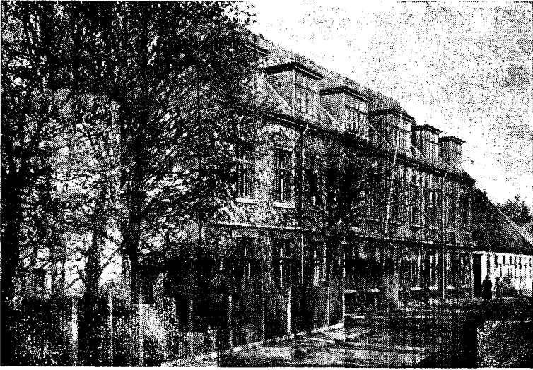
Mellem- og Realskolen.

og Bryggeriet. Skolen takker for den Elskværdighed og Beredvilighed, med hvilken Eleverne disse Steder bliver modtaget og vejledet.