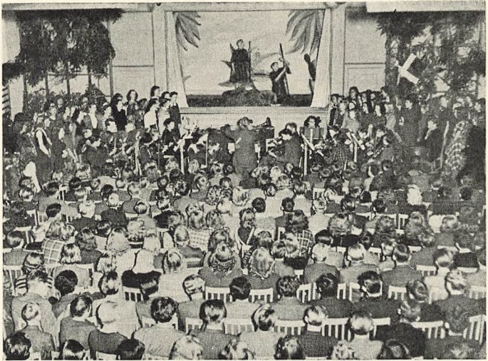
Fra Opførelsen af Julespillet.

Onsdag d. 5. December havde 2. M. fri for at deltage i Salget af Julestjernen.