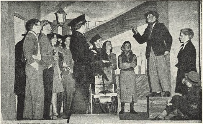
Scenebillede fra Opførelsen af »Vintersolhverv«.