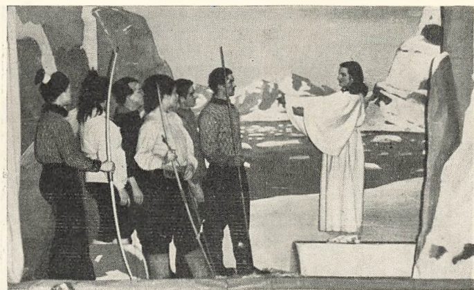
Scene af Skoleoperaen »Sagnet«.

Fredag den 25. Januar Skolebioforestillinger i Holte Bio: »Chico« for yngste Hold og Maxim Gorki-Filmen »Min Barndom« for ældste Hold.