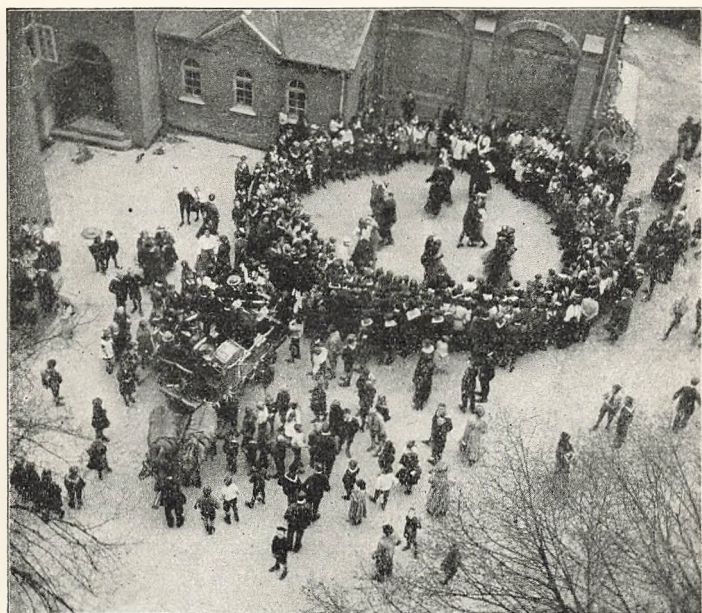
Børnehjælpsdagens forløb paa skolen, set fra skolens tag.