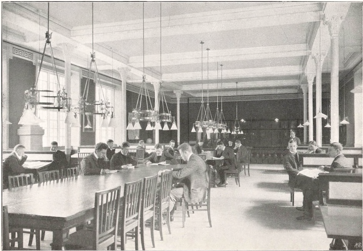
Læsesal og Bibliotek.