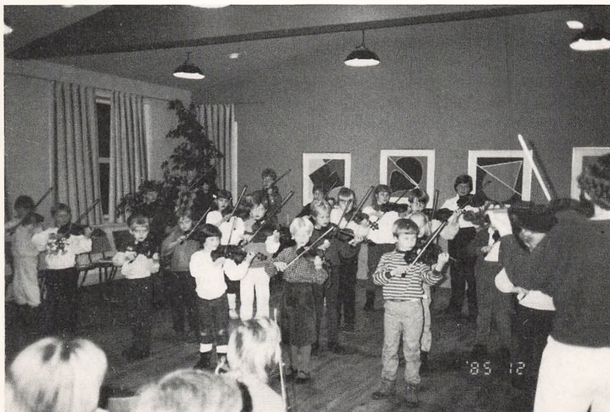
Suzukiholdet giver koncert på Musikskolen.

Grundkurseleverne har været et godt element i Musikskolens dagligdag. Der færdes nogle unge mennesker, også om formiddagen, øver sig og holder mange koncerter, og er i det hele taget et godt aktiv i Musikskolens samlede billede. Således præsenterede grundkurseleverne flere udadvendte koncerter med stor succes.