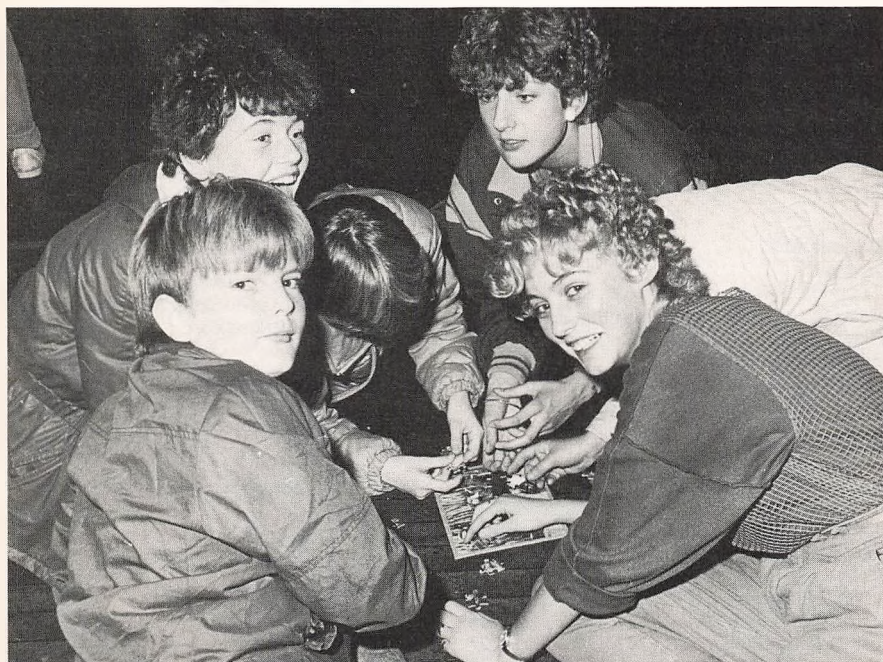
Aktivitet i ungdomsklubben.

for skoleåret 1. august 1985-31. juli 1986.