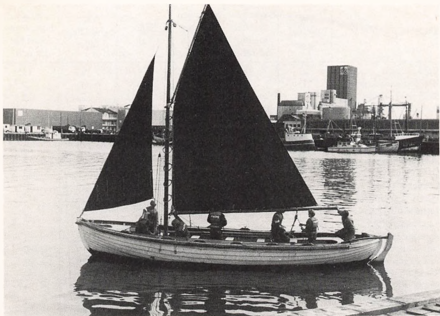
Fiskeri- og søfartslinjen til søs!