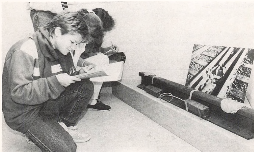
Skoleelever på besøg i besættelsessamlingen.

Udstilling af genstande fra første halvdel af vort århundrede, har kun været lidt benyttet af skoleklasser.