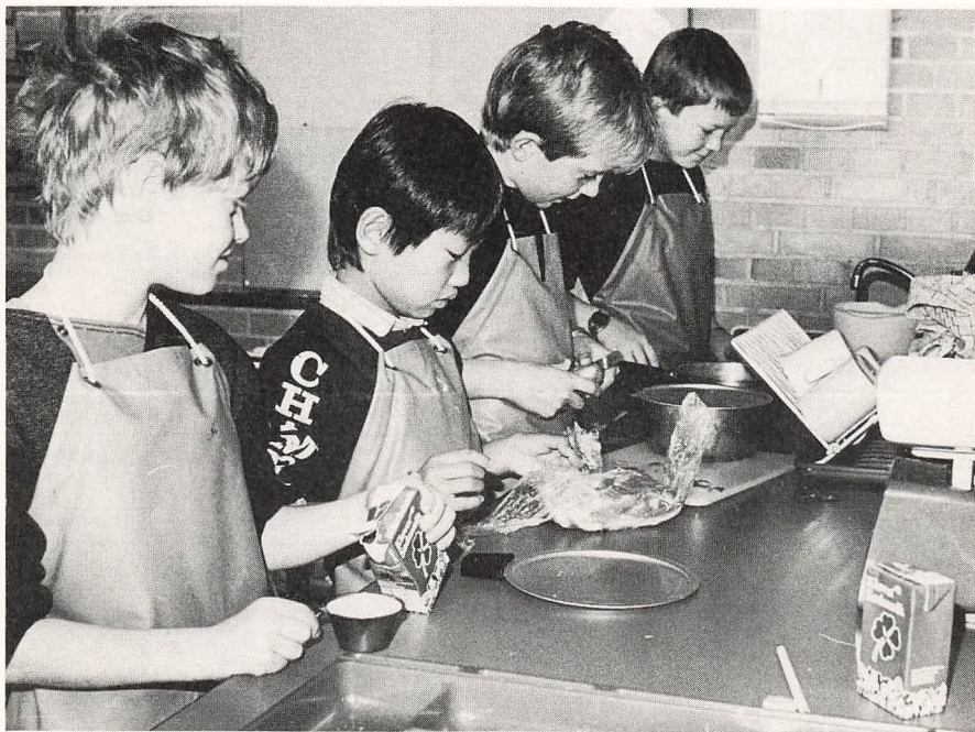
Hjemkundskab på Tjæreborg skole.

Statistikken tilsiger, at der i disse år bliver færre unge i den »autoriserede« ungdomsskolealder, og samtidig konstaterer vi, at opgaverne ikke bliver færre. Flere og flere unge bliver her i '80erne bragt i en situation, som gør det ønskeligt - om, ikke nødvendigt - at der etableres hensigtsmæssige voksenkontakter. Det sker mange steder - også på UNGDOMSSKOLEN.