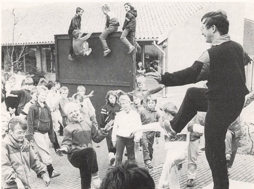
Opvarmning til skolens motionsløb, der afvikles sidste dag inden efterårsferien (Blåbjerggårdskolen).

Nogle tænker nok, hvorfor vi gerne vil gå her. Det kan vi kort og godt sige: Vi får lært at omgås andre, lært at løse konflikter i fælleskab, vi oplever medansvar, bl.a. gennem vore daglige pligter, der går på omgang, vi får et godt forhold til lærere og vore omgivelser.«