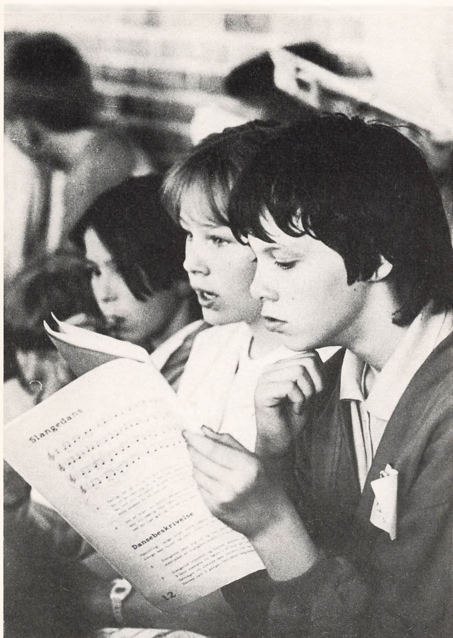
Sang på skolemusikdagen den 10/6-86.