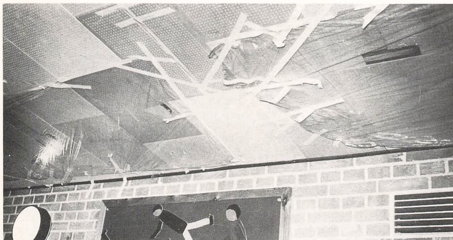
Angsten for asbestlofter er stor, derfor afdækning med plastic indtil loftspladerne udskiftes.