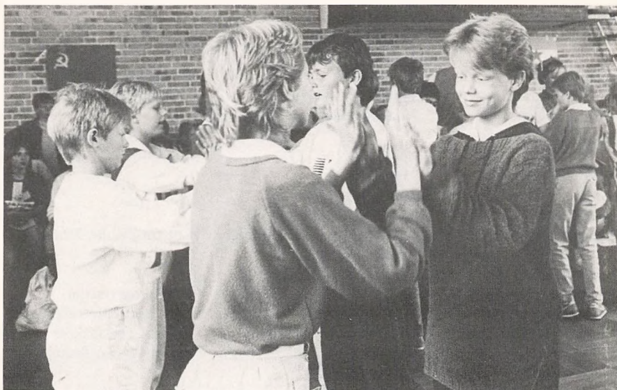
Skolemusikdagen blev en travl og festlig dag.