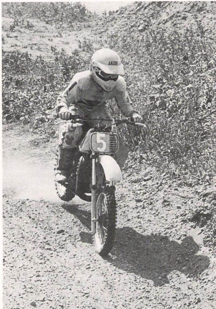
Ferieaktiviteter på Motor-cross banen ved Korskroen.

Biblioteks- og kulturforvaltningen i samarbejde med Musikskolen og Skole- og fritidsforvaltningen stod for det praktiske arrangement.