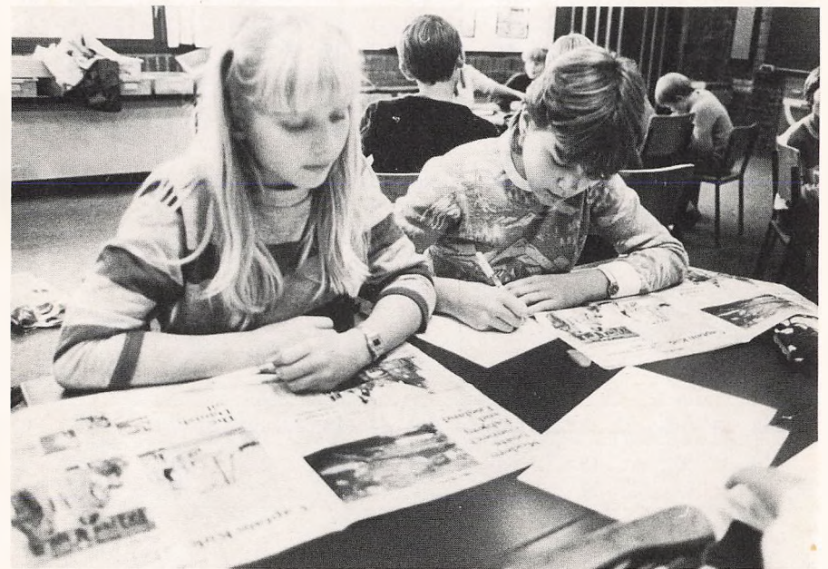
Tværfagligt undervisningsprojekt på Vestervangskolen.