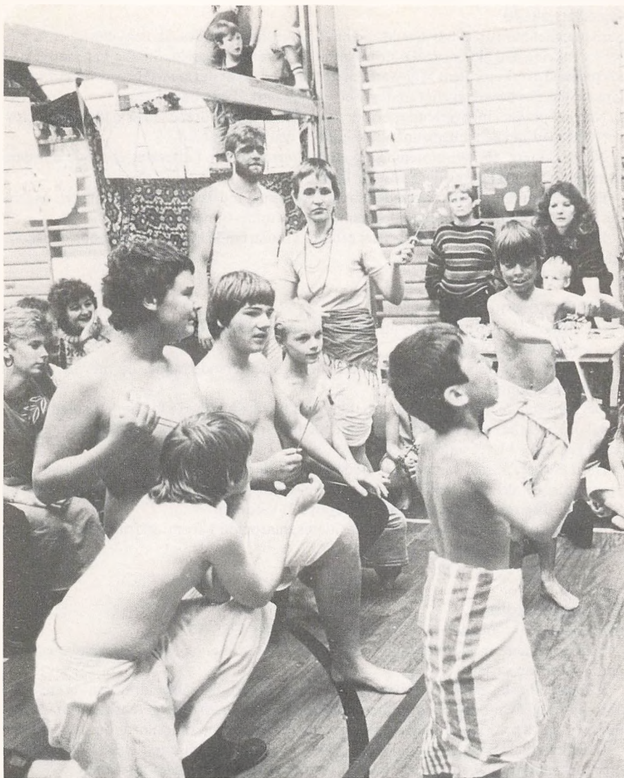
»Indisk marked« på Danmarksgades skole, for at skaffe penge til Esbjerg-skolen i Indien.

Et forberedende arbejde med en opstart af Gammelby skoles aktivitetsforening har set dagens lys. Her forventes et omfattende tilbud af diverse aktiviteter for såvel elever som bydelens beboere.