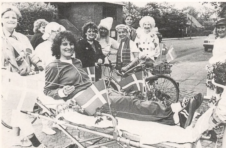
Lærertransport på sidste skoledag.