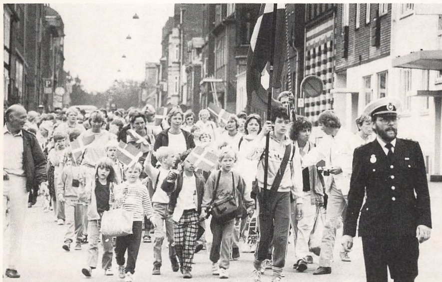
Eleverne fra Danmarksgades skole vandrer til banegården for at tage på udflugt, som frugtboden betaler.