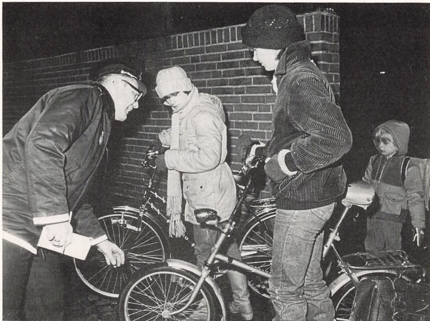
Cykeleftersyn på skolerne.

Af erhvervspraktikanter har politiet haft 3 hold à 6 elever i ugerne 46, 8 og 12, og selv om vi ved der er meget stor interesse for vort arbejde, har vi for nærværende ikke mulighed for udvidelser af tilgangen.