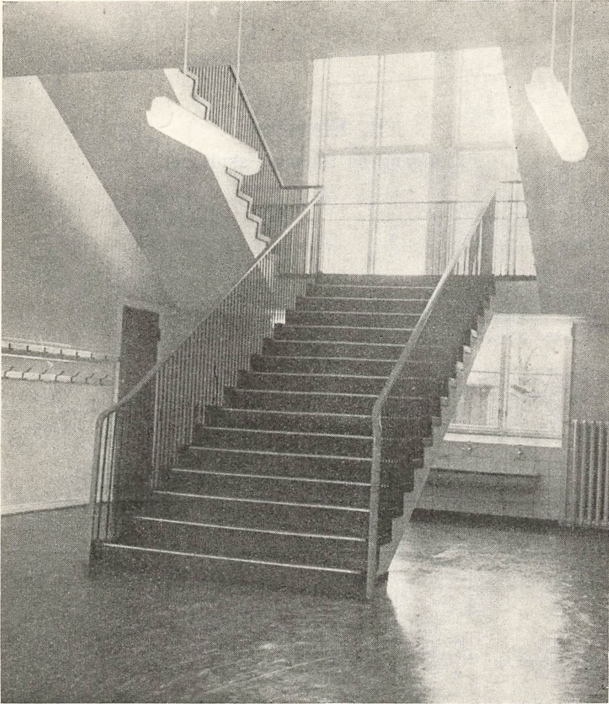
Opgang i A-blokken.

embeder til det nye skoleårs begyndelse; men det slog alligevel ikke til, idet timetallet samtidig voksede, svarende til 3 nye embeder. Efter en drøftelse i lærerrådet og skolekommissionen besluttede man at betræde den vej, der er anvist, at foretage en mindre nedskæring i klassernes timetal, så tre embeder bortfaldt, og samtidig at lade en del timer læse som overtimer af det faste personale. Det er beklageligt at skulle »slå af på idealerne« i form af reduktion af elevernes timetal, og den er selvfølgelig kun at betragte som en midlertidig foranstaltning. Skal standarden imidlertid ikke sænkes alt for meget, kræver det ikke blot en indsats fra skolens side, men også påpasselighed fra elevernes side med det hjemmearbejde, som med færre timer i skolen ikke bliver mindre påkrævet, såfremt målet alligevel skal nås, og i en sådan situation bliver det indseende med barnets hjemmearbejde, som må være forældrenes naturlige interesse, af ikke mindre betydning. Skolen venter også i den henseende hjemmenes forståelse og støtte.