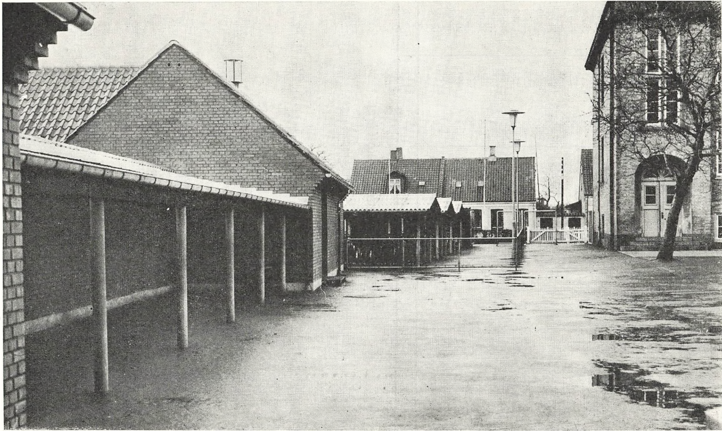
De nye toiletbygninger og cykelskure ved Østre Skole.