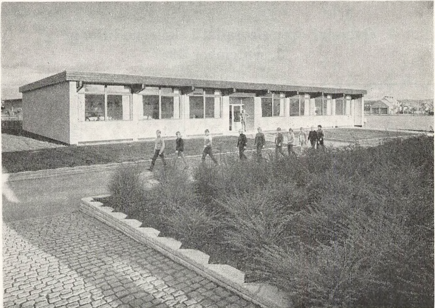
Sløjdbygningen ved Østre Skole.

På Aavangsskolen er der ingen ændringer foretaget ud over, at et par kælderlokaler i den sydlige fløj er blevet gjort anvendelige til brug for ungdomsklubben.