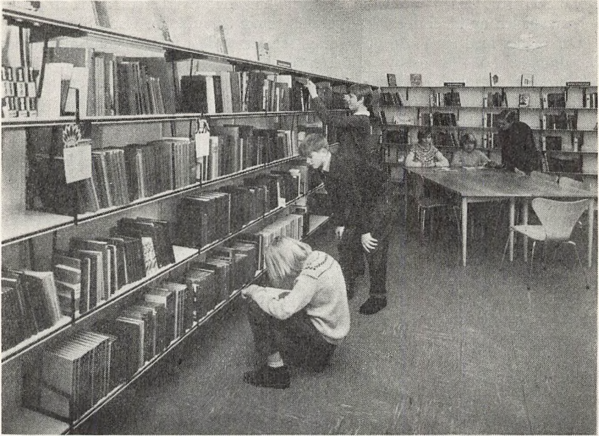
Skolebiblioteket på Aavangsskolen.