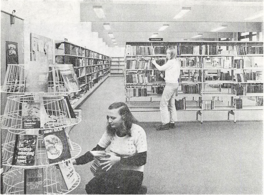
Fra skolebiblioteket på Østre skole

Restaureringen af den øverste etage i den nordlige del af fløjen mod Pingels Allé er blevet afsluttet samtidig med, at den planlagte restaurering af de næste to etager er blevet gennemført. Denne var ikke ganske færdig ved sommerferiens slutning, således at enkelte klasser måtte begynde skoleåret 1971-72 i midlertidige lokaler, som atter kunne forlades 14 dage ind i det nye skoleår.