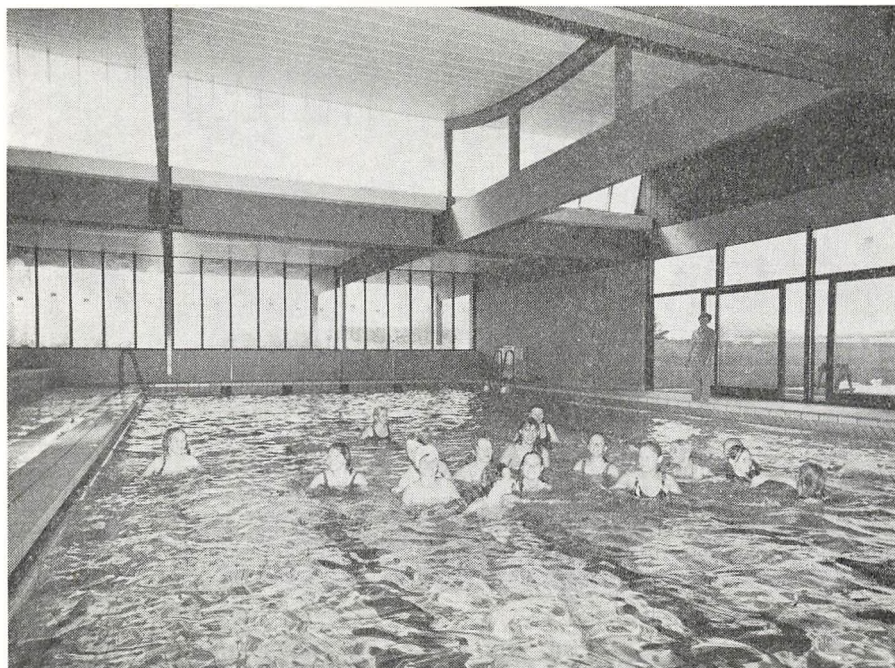
Svømmesalen på Søndermarksskolen

Også i skoleåret 1970–71 har Søndermarksskolens hverdag været præget af, at skolen stadig er under udbygning. Med skoleårets begyndelse rykkede eleverne ind i 5 nye klassepavilloner, der ligesom de øvrige 10 består af klaselokale, grupperum, toilet og gårdhave. Men manglen på fagllokaler til musik, håndgerning og formning bevirkede stadig, at 2 normalklasser måtte anvendes til disse fag. Derfor imødeså man med forventning, at de 3 fagllokaler kunne tages i brug i løbet af skoleåret, men på grund af en forsinkelse i byggeriet måtte man i slutningen af skoleåret se i øjnene, at dette først kunne ske fra 1/8 1971.