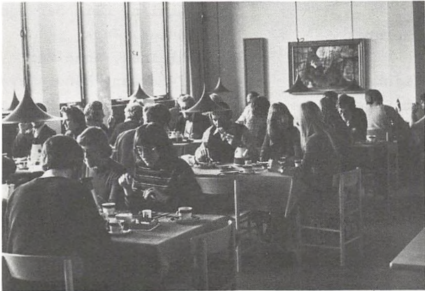
Lærernes kantine i den ny bygning.