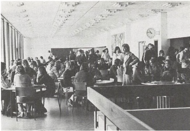
Elevernes kantine i den ny bygning.