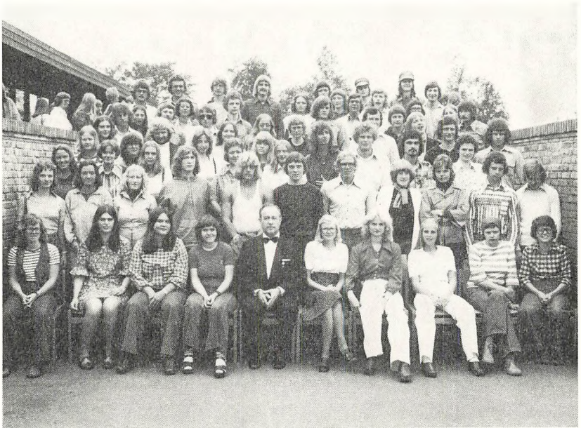
HF afgangsklasserne 1976

På møderne behandles cirkulærer og bekendtgørelser, og nævnet bliver orienteret om skolens dagligdag og problemer, ligesom eleverne aflægger beretning om stedfundne aktiviteter.