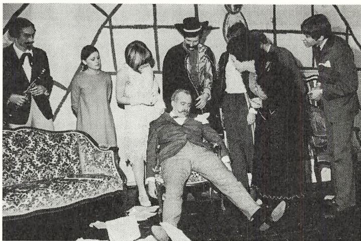
Lady Hurf: Han må ha' fået et slagtilfælde!