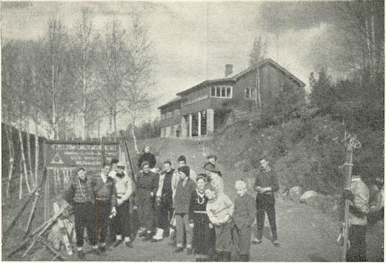
Påskerejsen til Norge 1953.