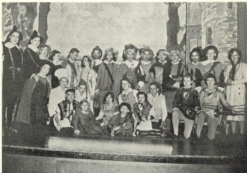
Skolefesten 1952 — »Kongens dom«.