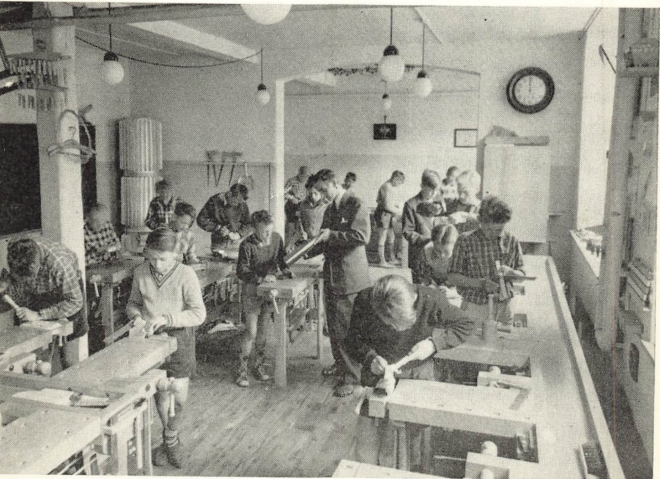
Slojdtid i 1. mellem