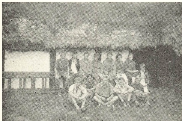
Lejrskolen besøger Musæumsgården på Læsø