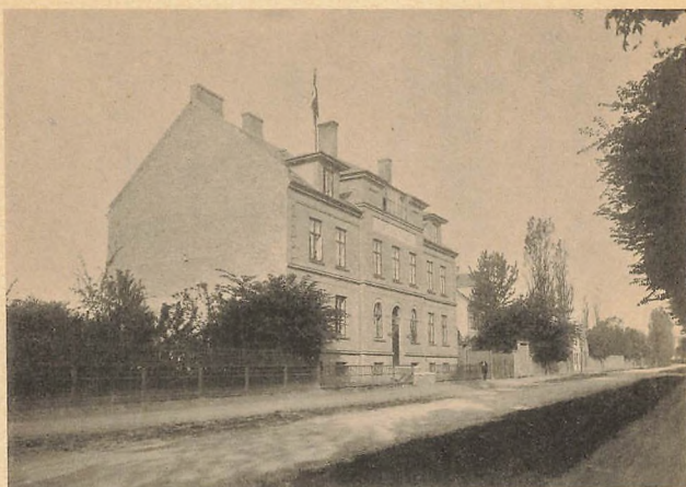
Facade mod Amalievei.