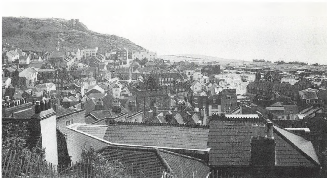
Udsigt over Hastings