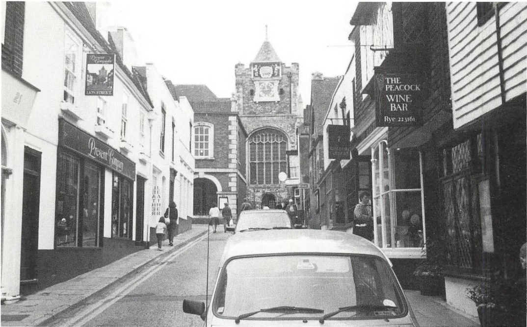
Fra den gamle, fine by Rye

så det blev sent igen den aften. Vi var i Hastings kl. 1 om natten.