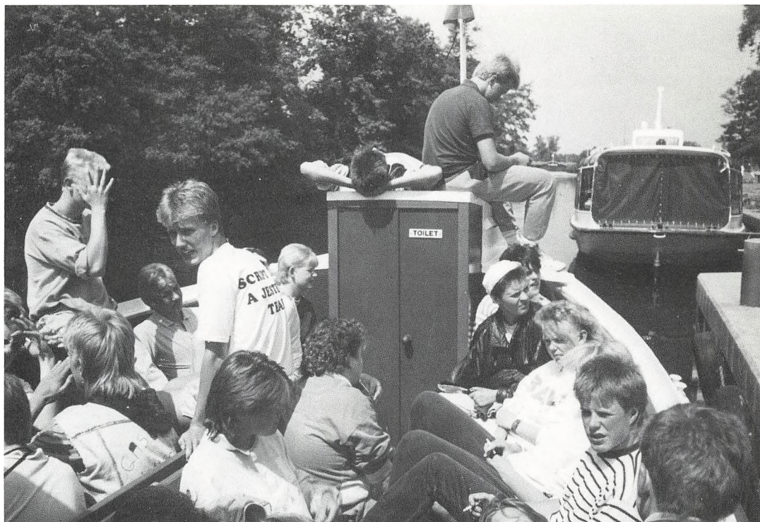
På Himmelbjergstur den sidste skoledag