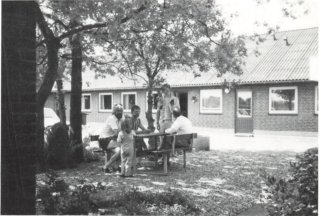
Situation fra elevmødet '88

Nu er det aften, klokken er otte, sport, spil, synge og danse, mine sanser de sanser. Atter en aften, intens og hurtig, husk på lørdag! Klokken ringer – vi nåede det ikke, rengøringshold, måtter der bankes, en træt lærer der lister rundt med en liste. God nat! drøm godt dagen nu, er fortiden du drømmer i morgen.