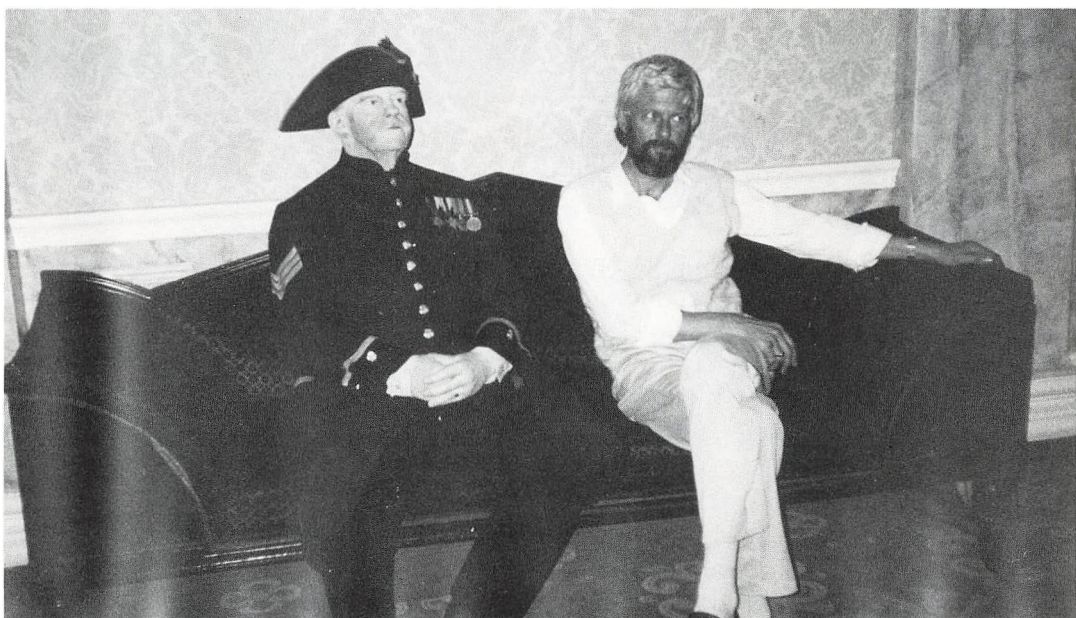
Madame Tussauds voksabinet