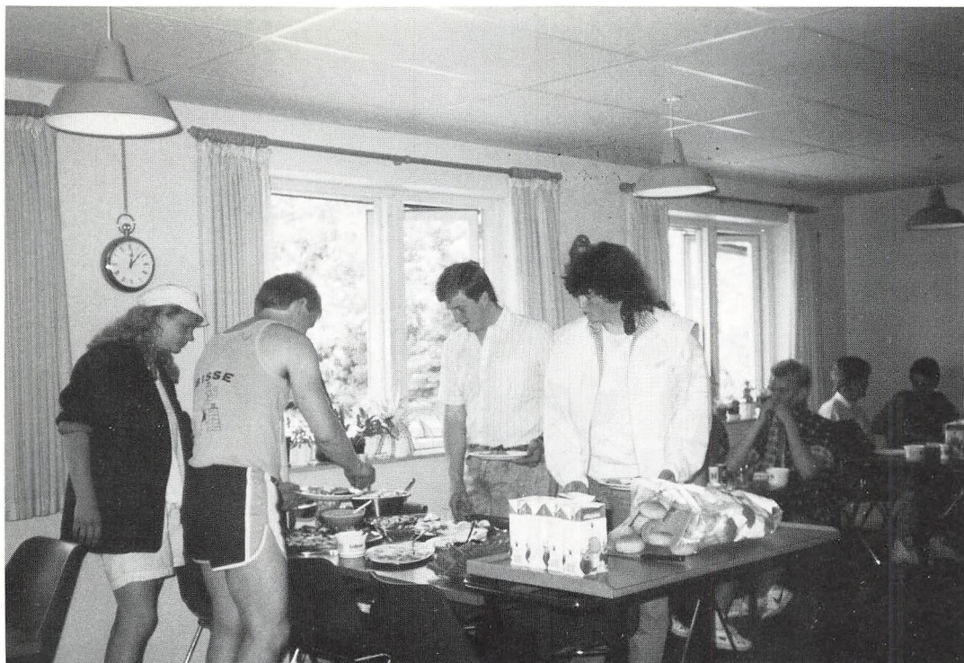
Elevmøde maj '88

elever havde nogensinde før prøvet at deltage aktivt i sådan et arrangement, så det siger næsten sig selv, at det var noget af en oplevelse. I dagene op dertil havde mange ytret usikkerhed. De syntes, de lavede for mange fejl, de syntes, de så komiske ud i netop de gymnastikdragter, de syntes, det var »flovt«, at andre skulle se på dem osv., osv. Det viste sig heldigvis, at deres bange anelser var ganske ubegrundede. Det gik godt med opvisningen – vi har jo aldrig udgivet os for at være elitegymnaster – og det fineste ved det hele var, at eleverne virkelig oplevede