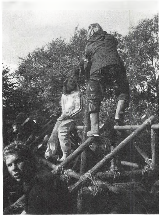
Jernalderhus (efter originale mål)