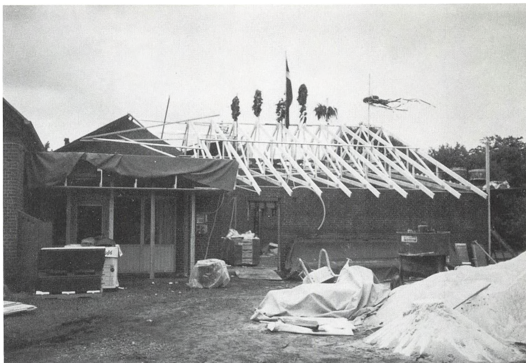
Rejsegilde d. 1. sept. '88

til at gå i trykken, er vi lige startet på vores juleværkstedssuge, der skal afsluttes søndag med »Åbent-hus.« Programmet byder på gymnastikopvisning, salg fra julestuen, kaffe, gløgg og æbleskiver. Vi ved, tiden indtil jul går hurtigt, og vi har noget at glæde os til straks efter julefe-