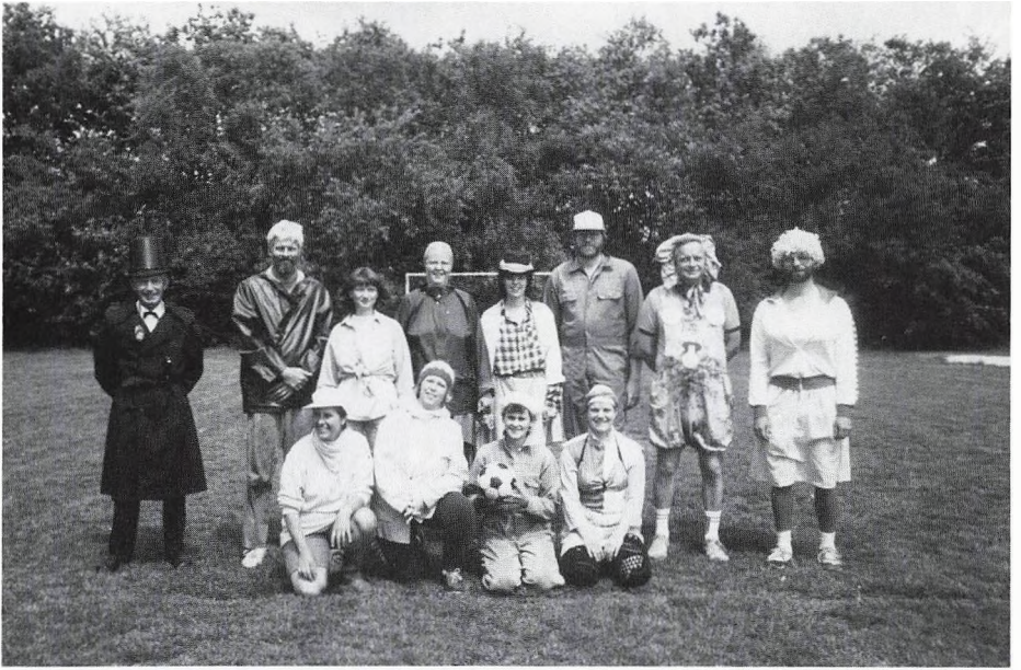
De gamle drenge. Gammel elevdag.