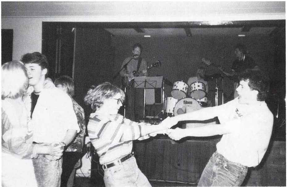
God musik. Gammel elevdag.