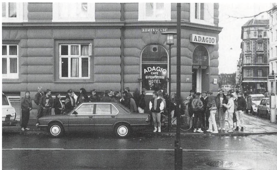
Indkvarteringssted. Københavnertur, november 91.

Vi holder inden ferien en skolejuleaften. Da spiser vi flæsketeg med rødkål og ris a la mande med mandel i hver serveringsskål. Der synges julesange og -salmer omkring juletræet, den årligt tilbagevendende julehistorie læses, og vi spiller banko med mange små præmier.