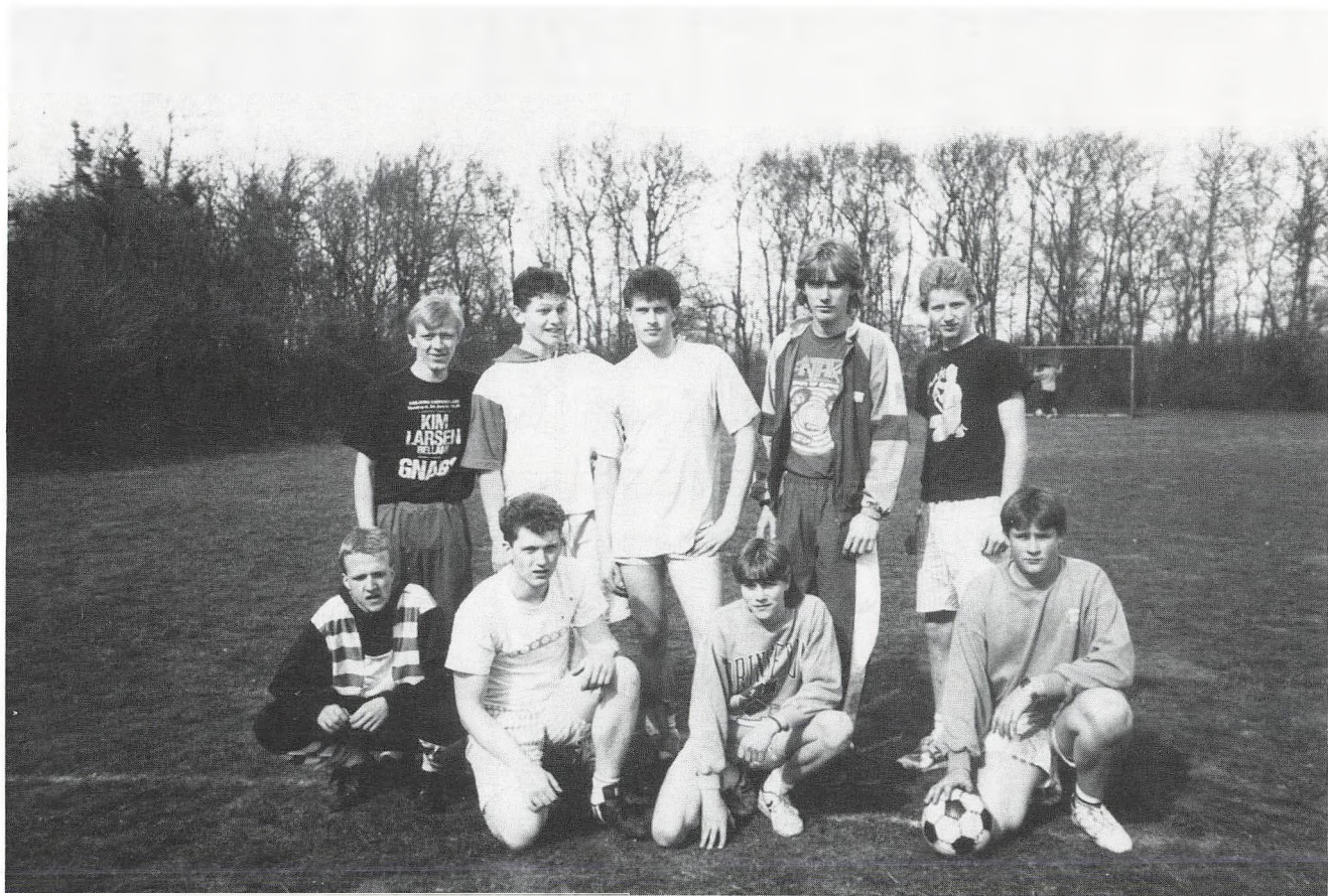
6 Superfodboldhold på Hoven Ungdomsskole.