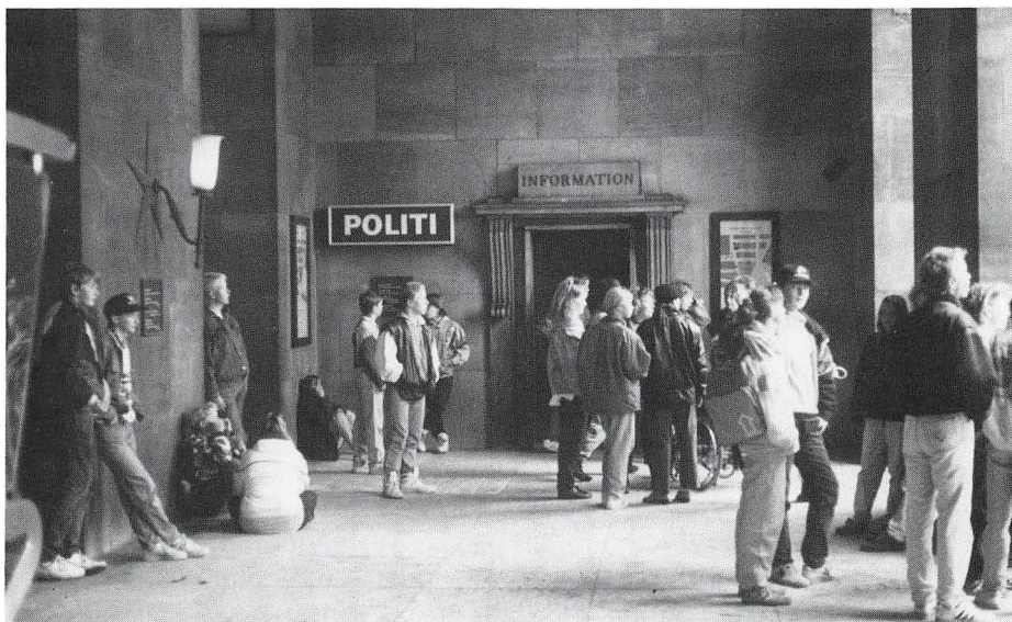
Fra besøg på politigården i København.