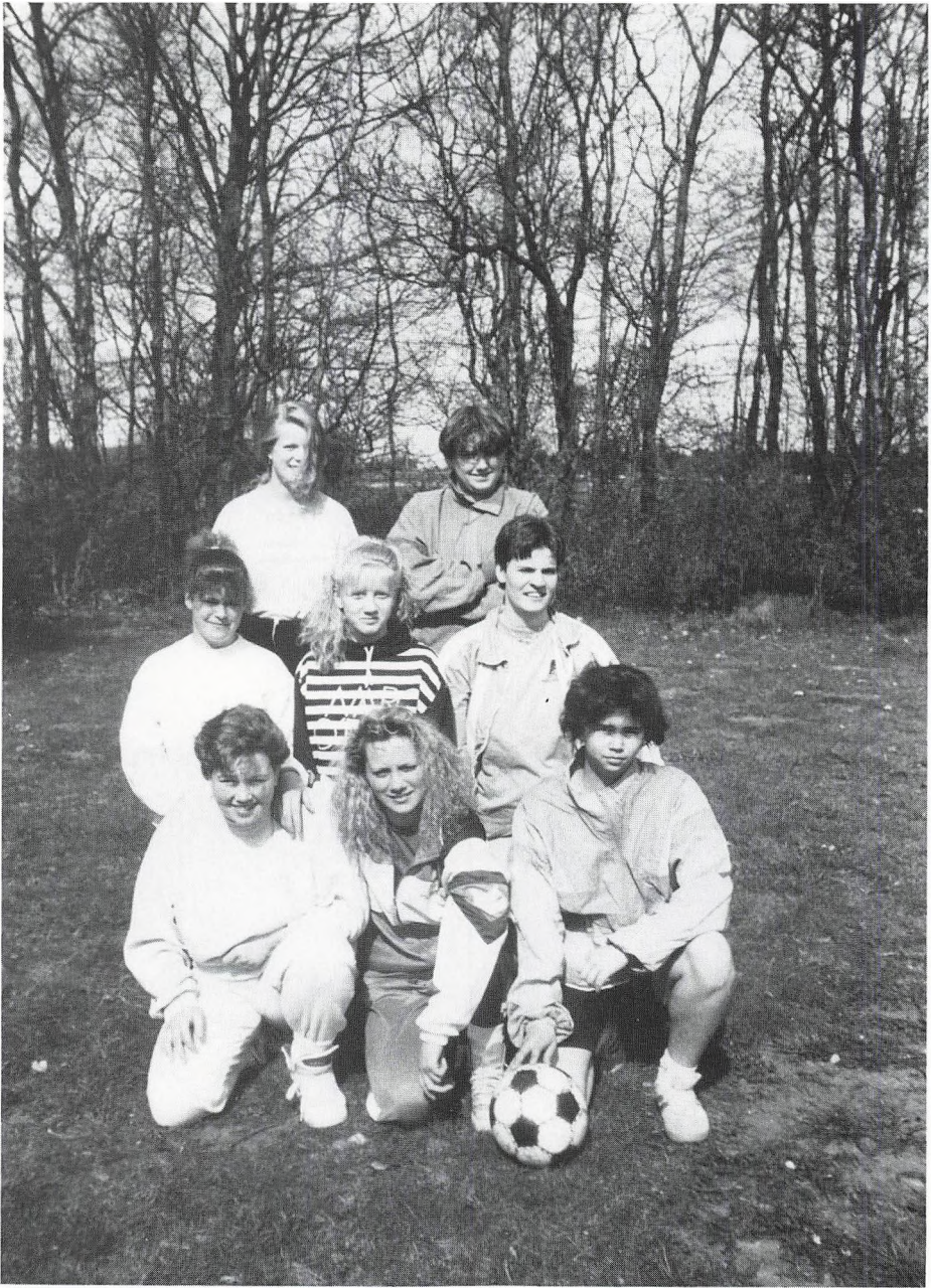
De gamle piger. Gammel elevdag.