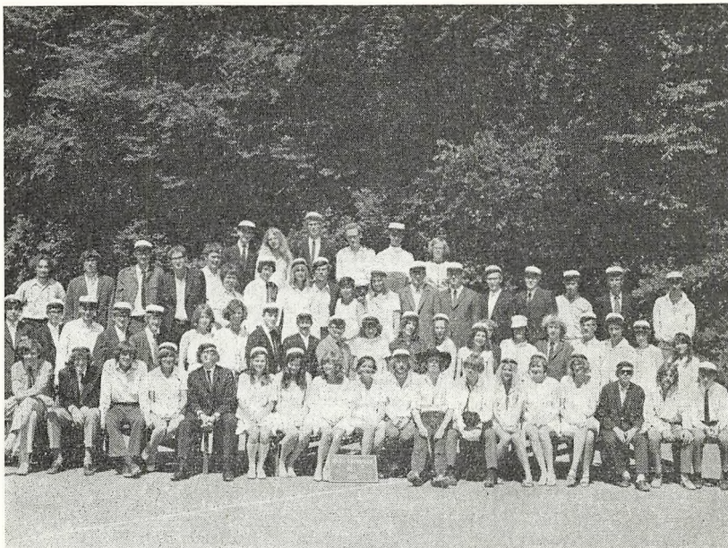
De matematiske studenter 1970.