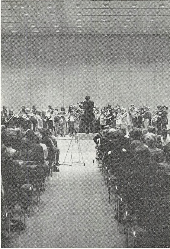
Fra musikskolens opvisning i den nye festsal.