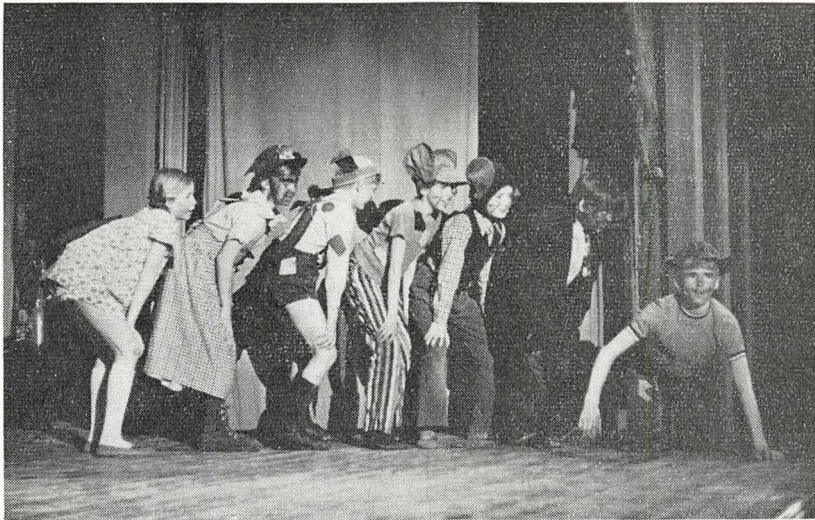
Fra opførelsen af „Dyrene i Hakkebakkeskoven“.