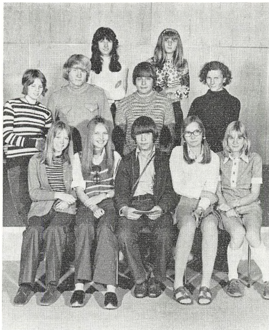
9. klasse 1971.