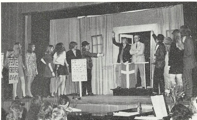
Fra opførelsen af „Frihed – det bedste guld“.