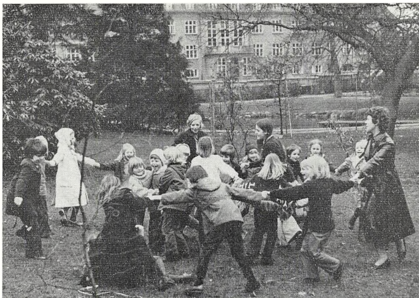
Børnehaveleg i haven.