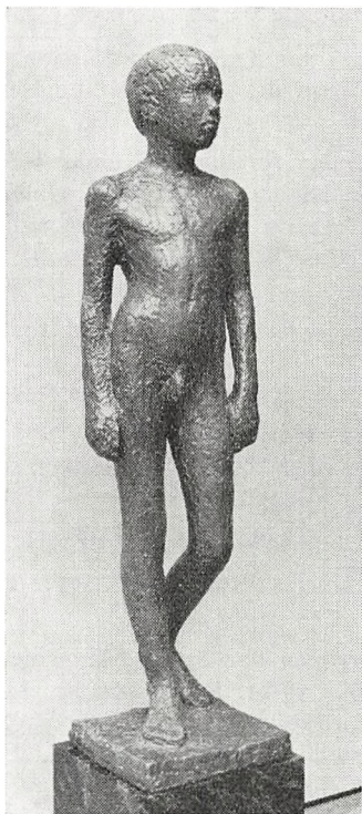
Knud Nellesmose: „Ib“.

Efter aftale med eleverne uddeltes for første gang ingen bogpræmier.