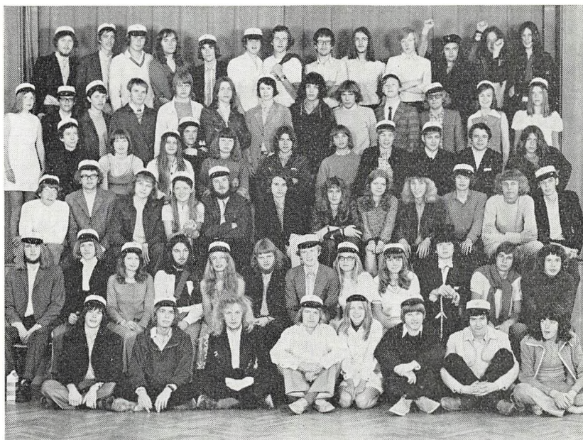
De matematiske studenter 1972