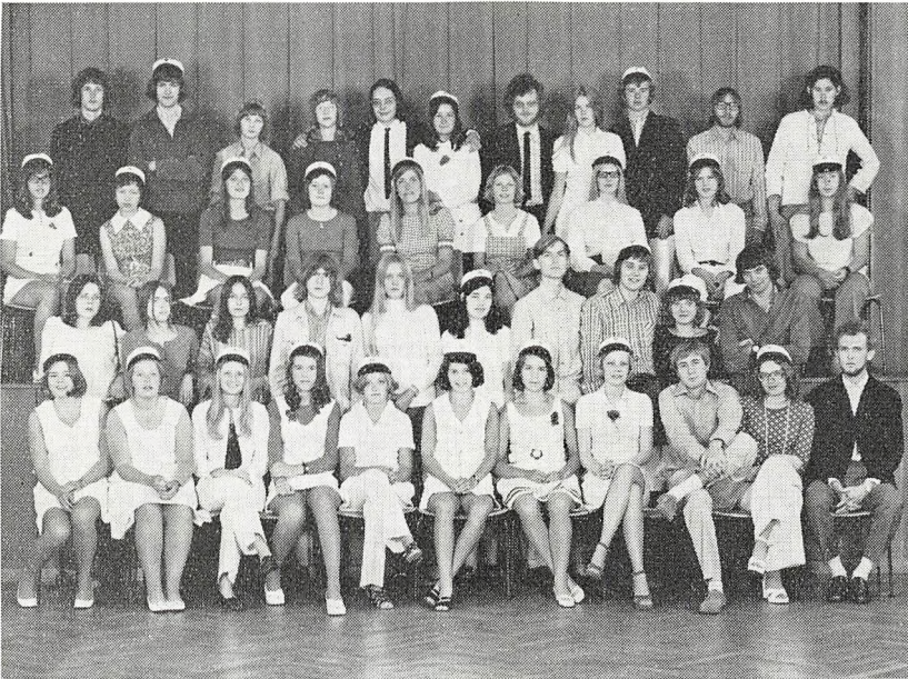
De sproglige studenter 1972