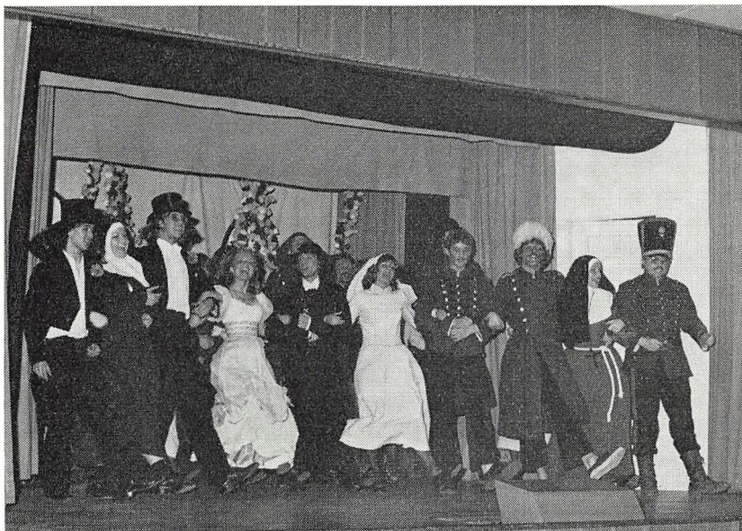
Fra opførelsen af „Frøken Nitouche“.

Lørdag den 17. marts overværede elever fra 2 sc+mu opførelsen af „Medea“ på Det ny Teater.