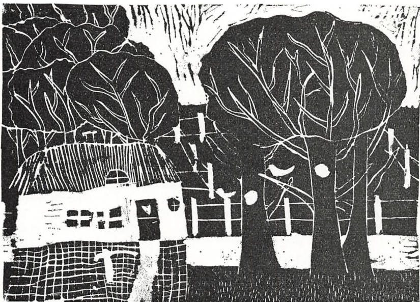
Grafik fra 5. klasse (linoleumstryk).