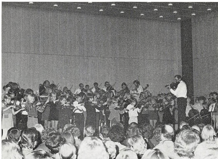
Fra musikskolens jubilæumskoncert.