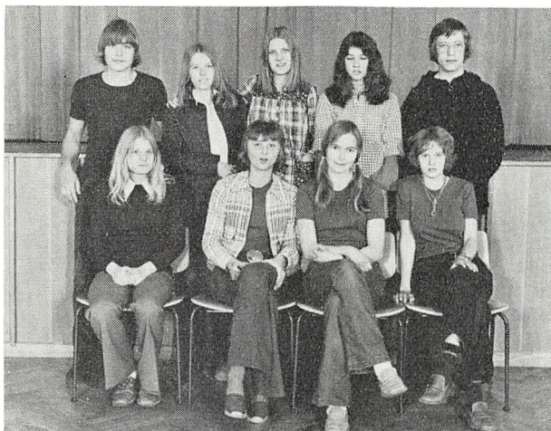
10. klasse 1972