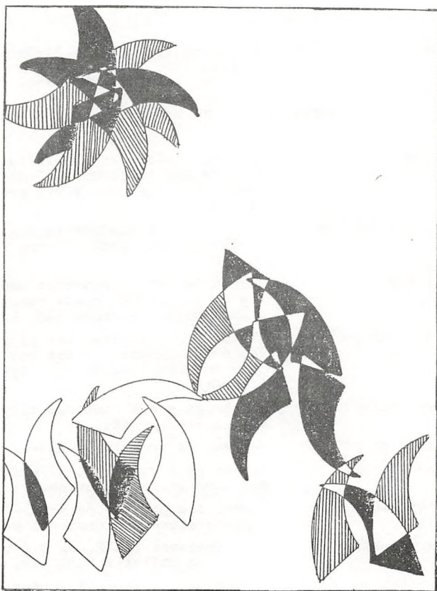
Tuschtegningen er udført af en elev i 2.g