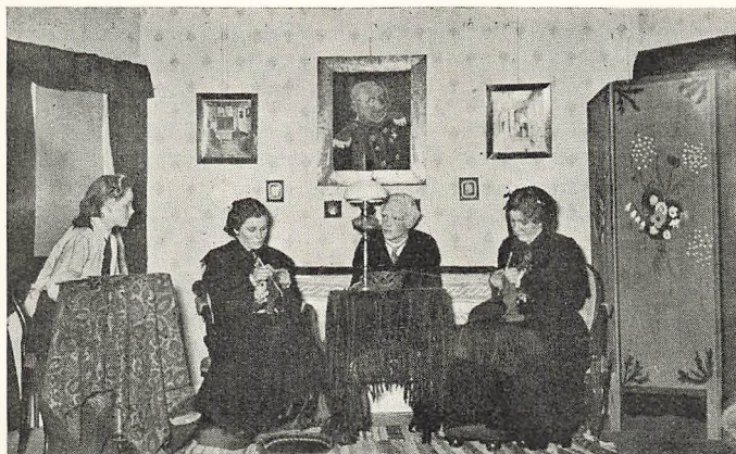
Scene fra »Skærmydsler«.