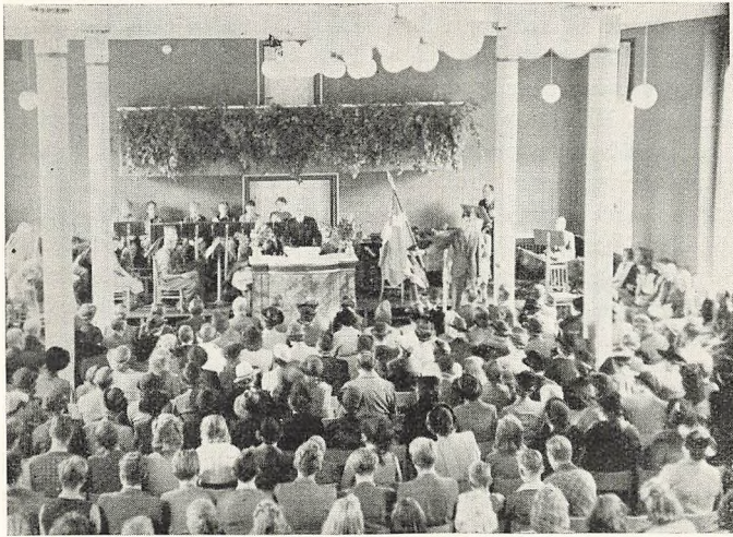
Fra Festen i Anledning af Hs. Maj. Kongens 70 Aars Fødselsdag.

Senere kaldtes vore Konger Skjoldunger . Og de fleste af Jer har jo allerede i Historietimerne hørt om en Række dygtige Konger med de samme Egenskaber, som vore Forfædre tillagde Skjold, lige fra Gudfred , vor første historisk kendte Konge for 1100 År siden, den Konge, der byggede det ældste Dannevirke