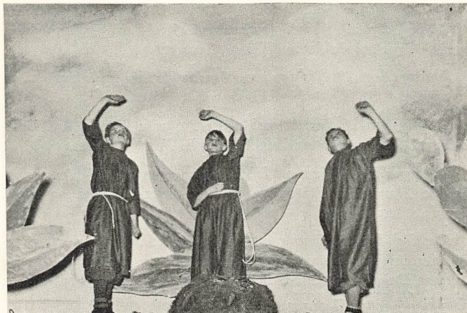
Scene fra Julespillet »Julen har bragt —«.

Mandag den 25. November var der med Titlen »En Skole med Musik i« Radioudsendelse fra Holte Gymnasiums Musikskole, hvor Lærere gav Forklaringer og Elever behandlede forskellige Instrumenter.