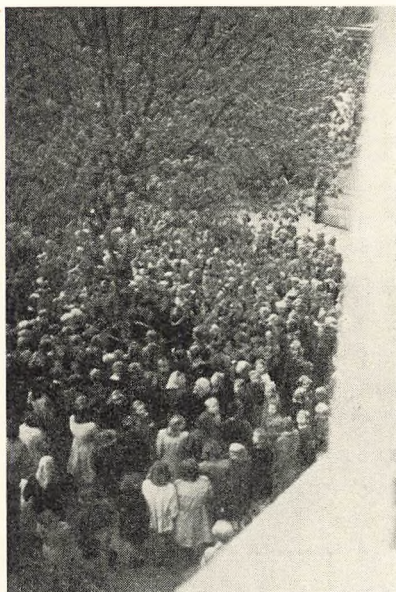
Skolens lind på jubilæumsdagen.

bære hovedansvaret for; men de, der kom, fik en udmærket aften ud af det, og skolens lærere fik nok at bestille med at hilse på elever, man ikke havde set i en årrække.